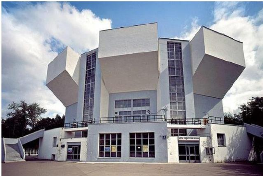
Рабочий клуб имени Русакова. 1927-1928. Москва. Архитектор К. Мельников