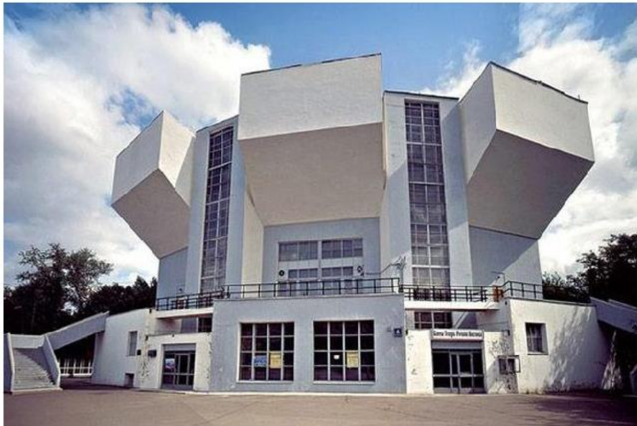
Рабочий клуб имени Русакова. 1927-1928. Москва. Архитектор К. Мельников