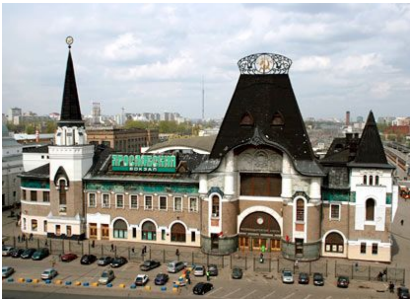
Здание Ярославского вокзала.