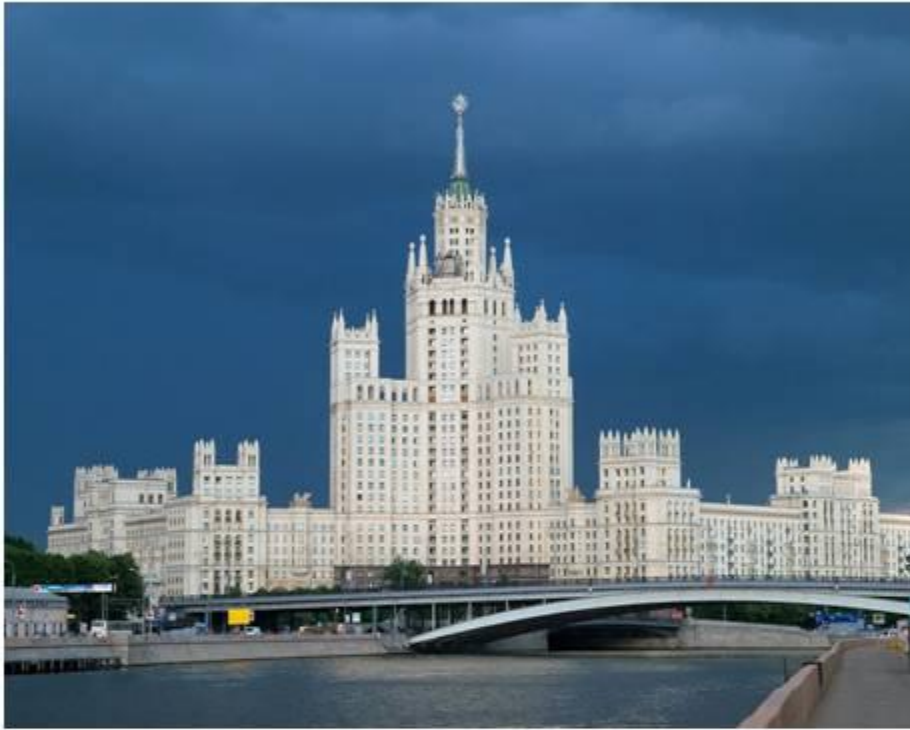
Жилой дом на Котельнической набережной