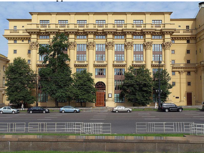
Дом на Моховой