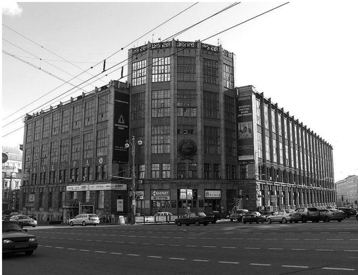
Здание Центрального телеграфа