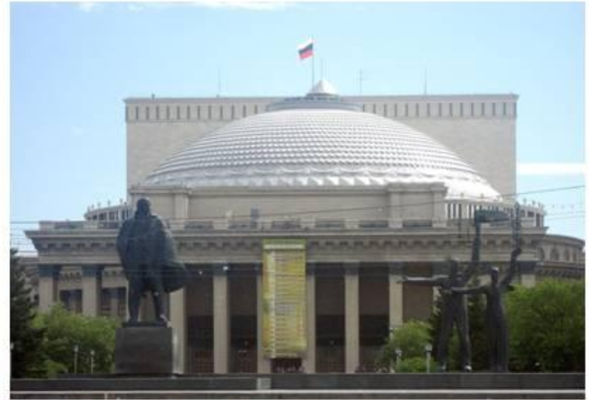
Новосибирский оперный театр