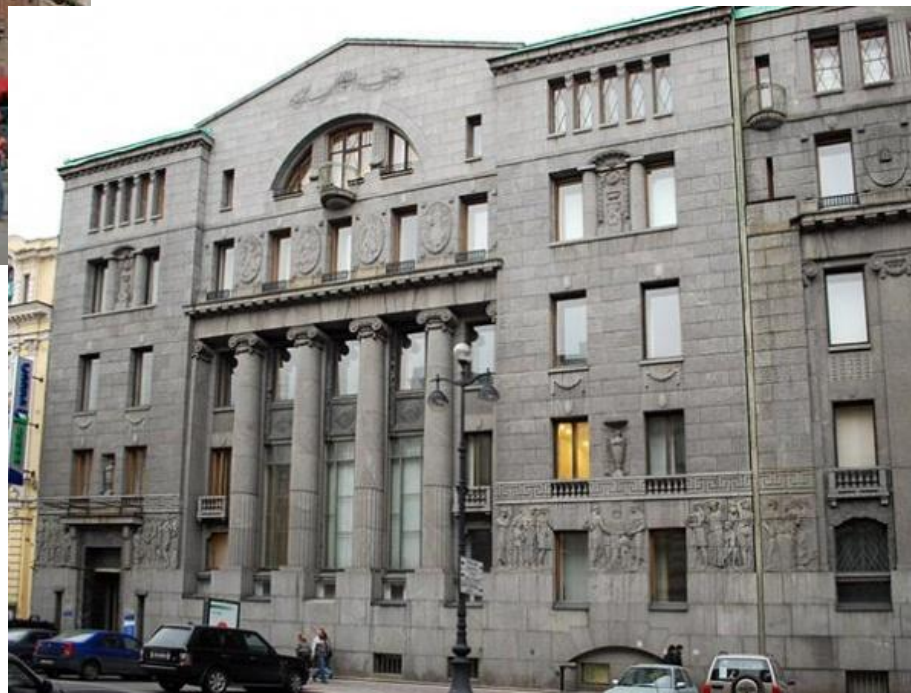
Здание Азовско-Донского банка в СПб