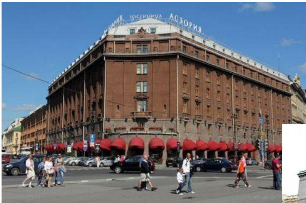
Федор Лидваль Гостиница Астория