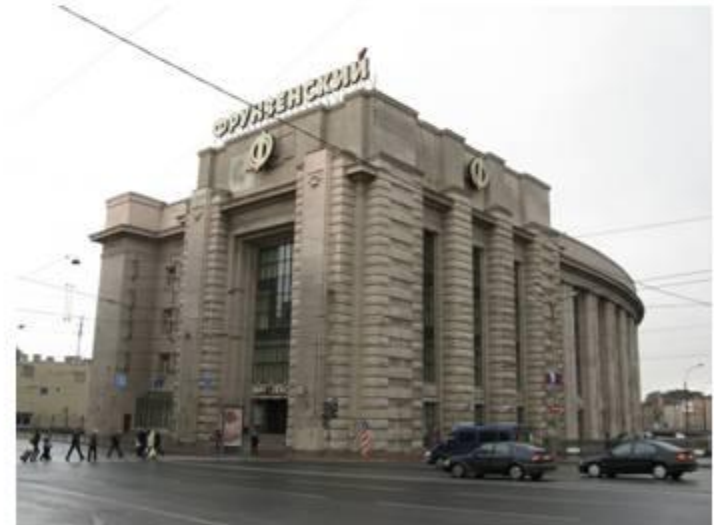
Универмаг «Фрунзенский» в Санкт-Петербурге