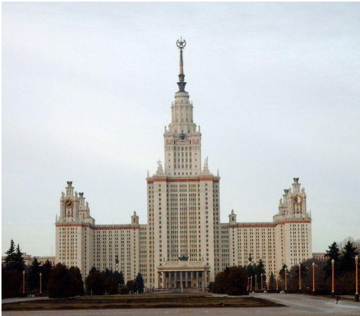
Главное здание МГУ . Архитекторы: Л. Руднев, П. Абросимов, С. Чернышёв, А. Хряков