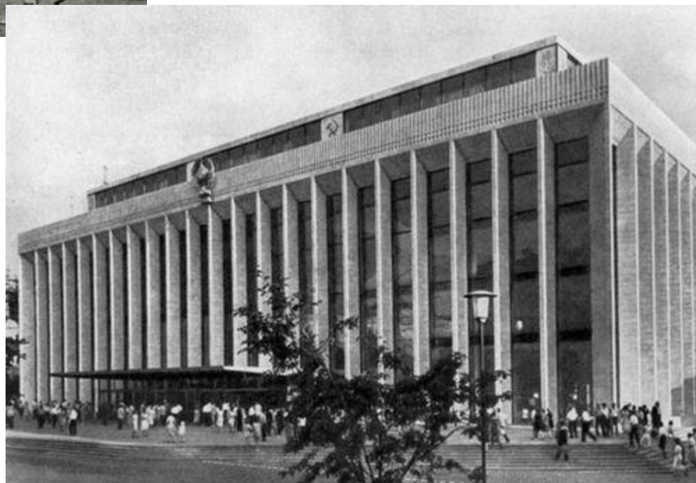
Кремлевский Дворец Съездов