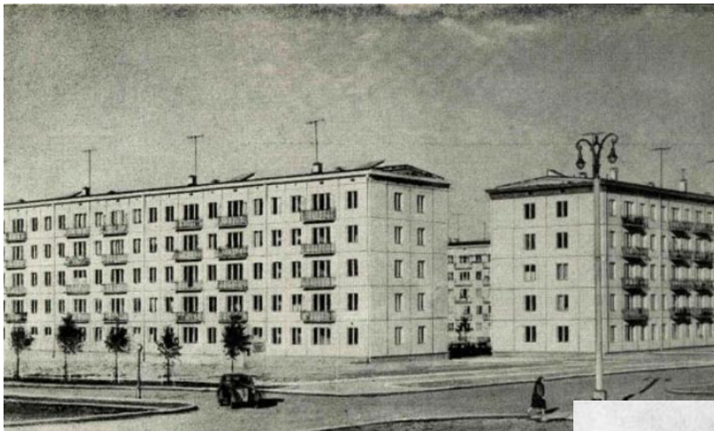
Пятиэтажки при Хрущеве