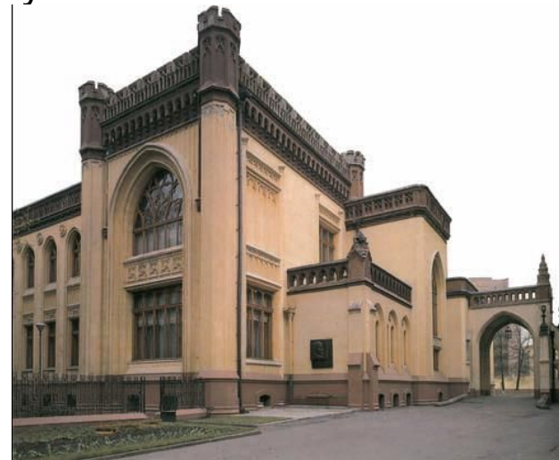
Особняк З. Г. Морозовой на Спирidonовка