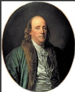
Франклин, автор конституции США