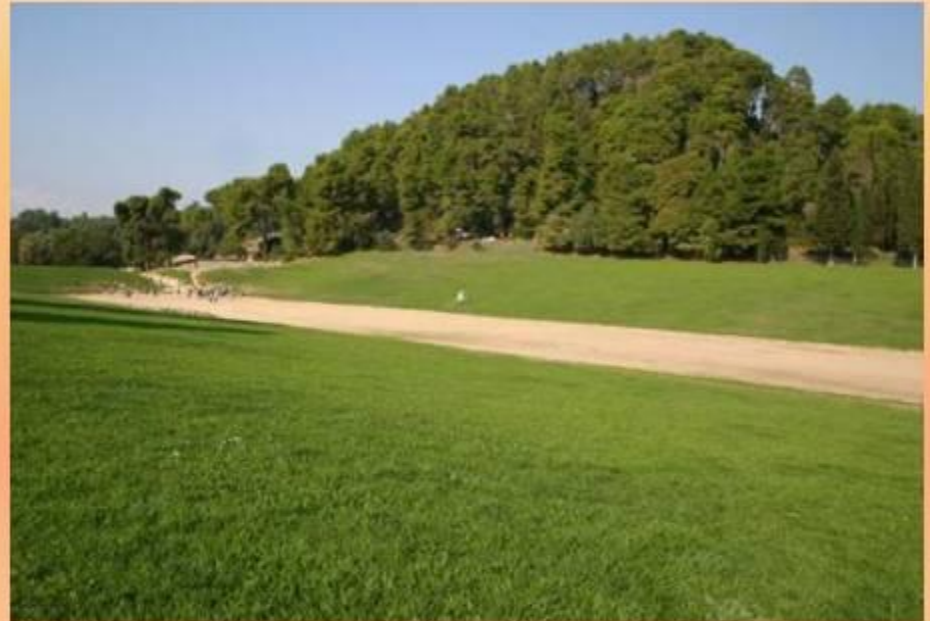
Стадион в Древней Олимпии