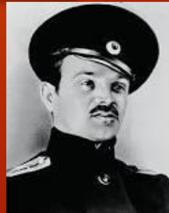
Композитор: Василий Агапкин

«Этот марш не смолкал на перронах Когда враг заслонял горизонт. С ним отцов наших в дымных вагонах Поезда увозили на фронт...»