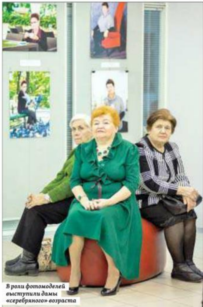
В роли фотомоделей выступили дамы «серебряного» возраста