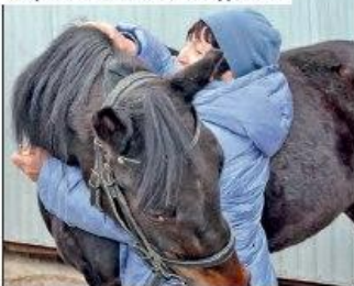
Морковка помогла стать друзьями

– Посмотрите на их счастливые лица! Позитивное влияние животных очевидно! – заме-