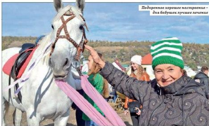
Подаренное хорошее настроение – для бабушек лучшее лечение

Сам вид благородных животных вызвал восторг у экскурсанток. Подойдя к загонам, они спешили погладить