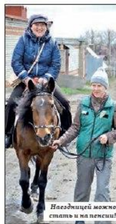
Наездницей можно стать и на пенсии!

гнедых и рысаков, которые живо отзывались на ласку.