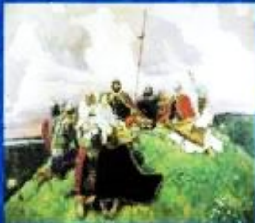
Киевский сказитель Баян

У Баяна вещего, бывало, Если петь он начинал о ком, Мысль, как серый волк в степи бежала, Поднималась к облакам орлом... Но не десять соколов взлетали, А Баян персты на струны клал, И живые струны рокотали Славу тем, кто не искал похвал. (Перевод Н.И.Рыленкова)