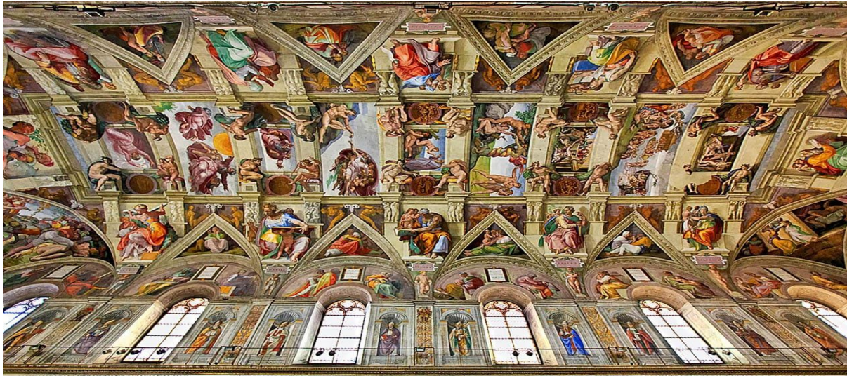
Сикстинская капелла. Ватикан. Фреска (1508 - 1512)