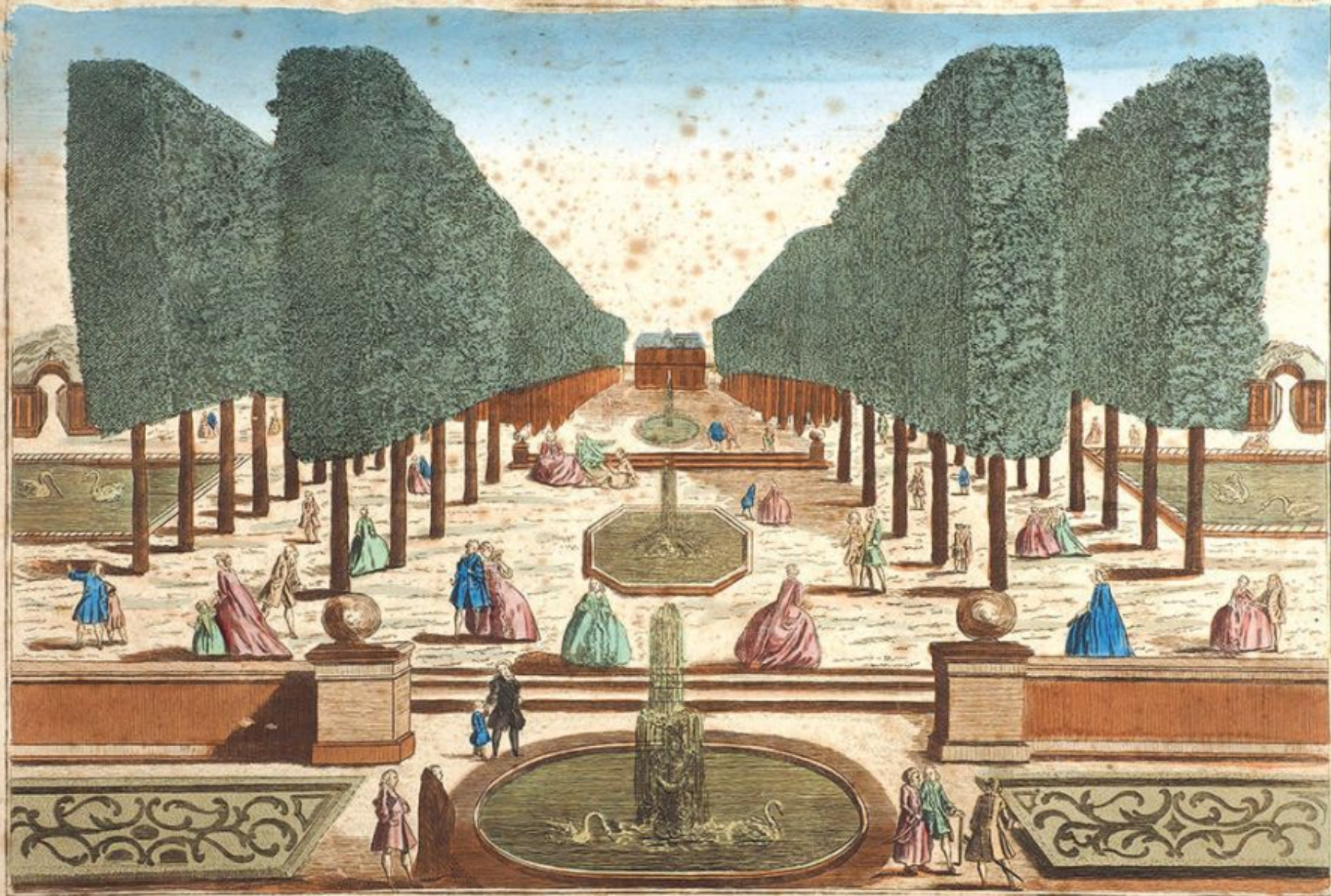
Vue perspective d'une Maison de Plaisance aux environs de Moskou pres le Canal qui conduit à S t Petersbourg en Russie

A Paris chez J. Charras rue S t Jacques au delà de la Fontaine S t Severin an 1742. Colette N o 257