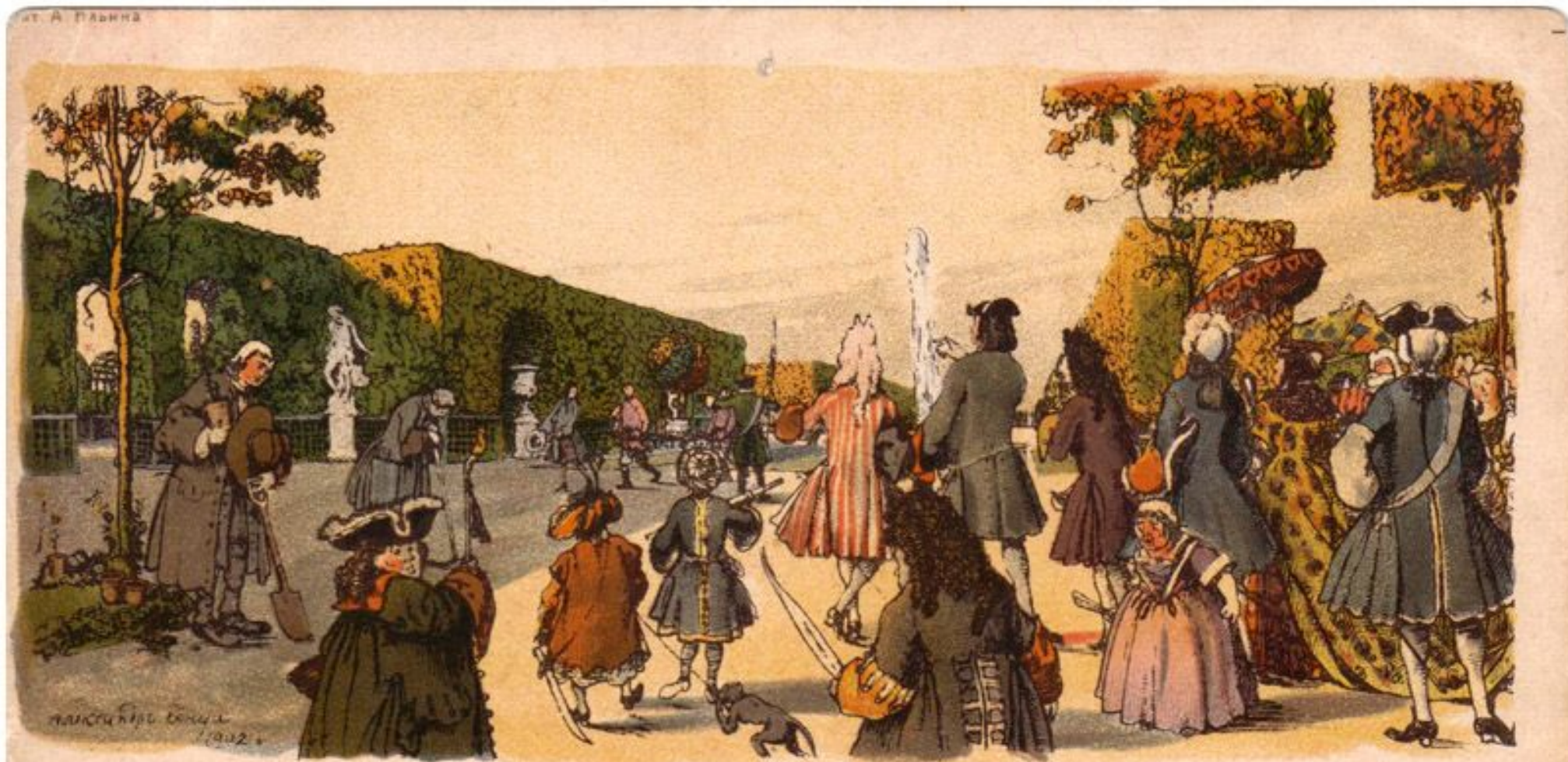
Летний садъ при Петръ Великомъ