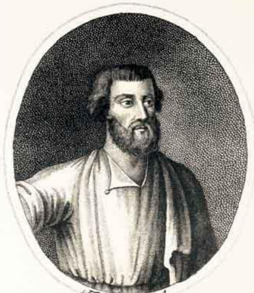
А. Мининъ, Козьма Мининъ, Гражданинъ Нижегородскій,