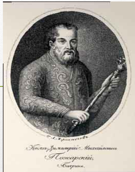
Д. Пощарскій, Дмитрийъ Пощарскій, Бояринъ.