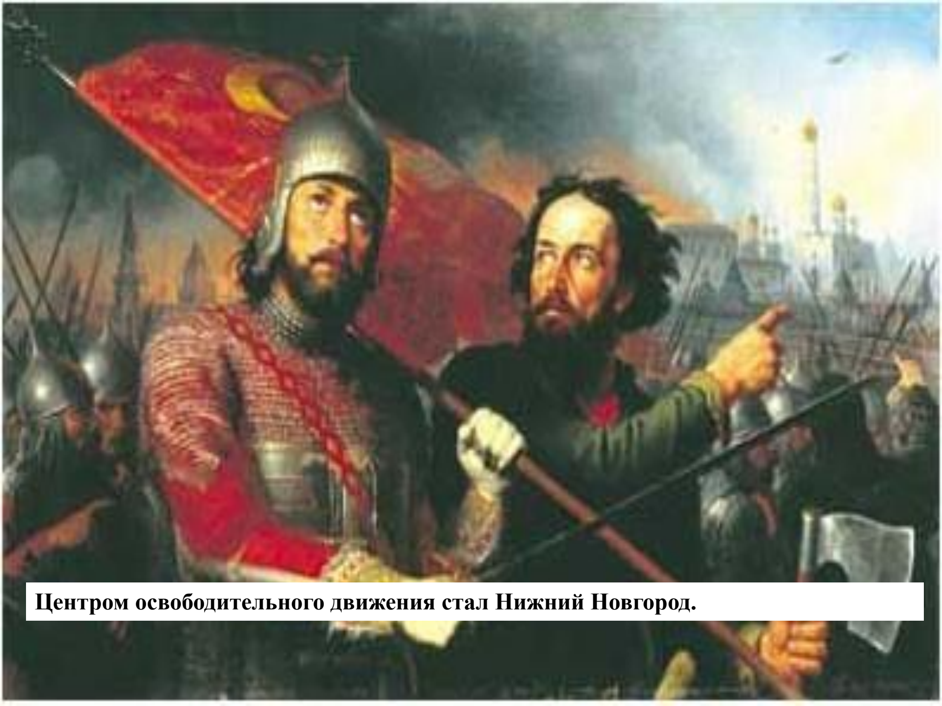
Центром освободительного движения стал Нижний Новгород.