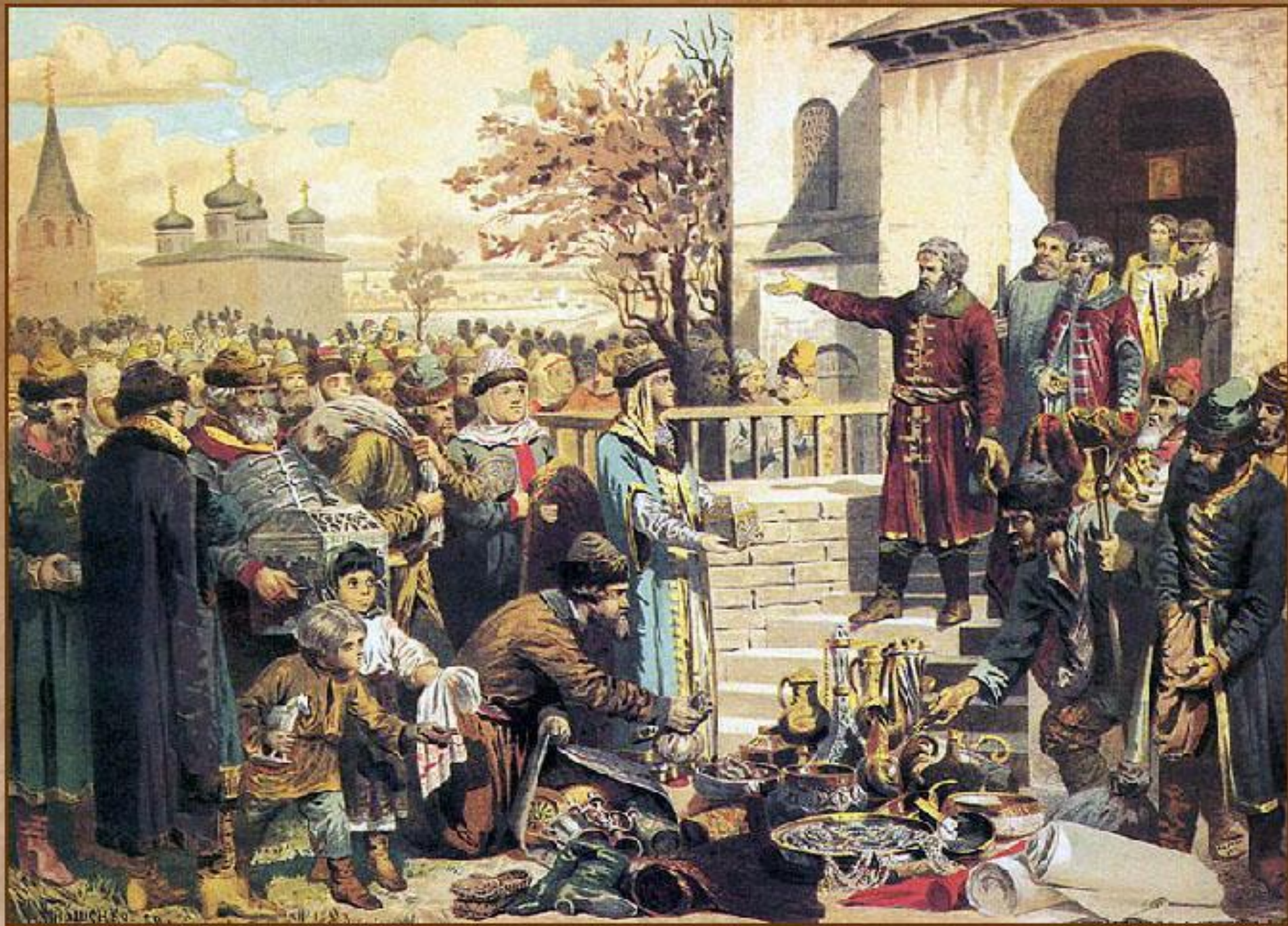
Воззвание Козьмы Минина к нижегородцам