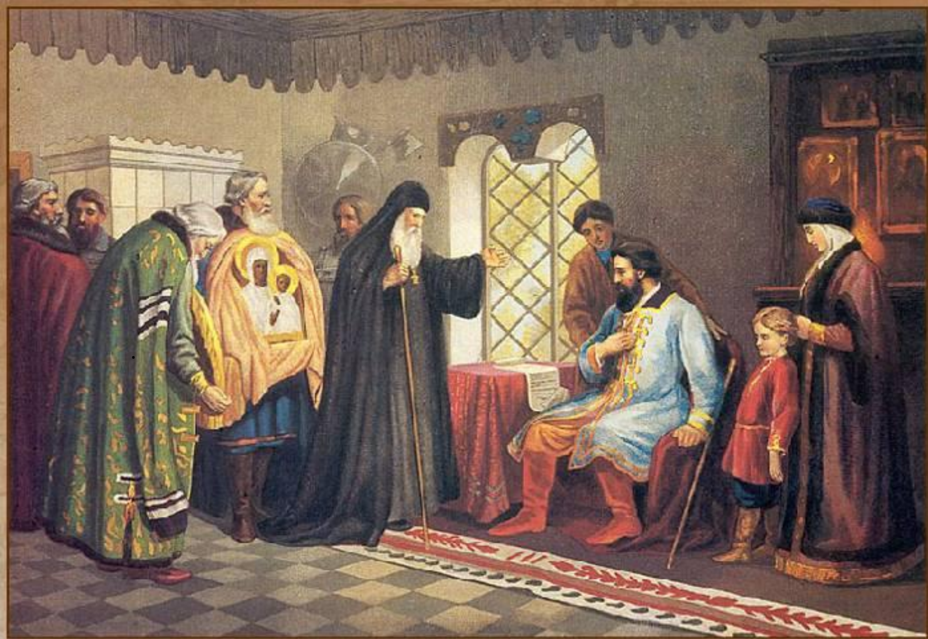
Нижегородские послы у князя Дмитрия Пожарского. 1611 г.