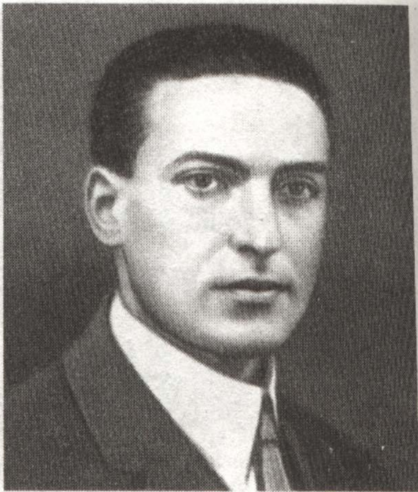
Л. С. Выготский