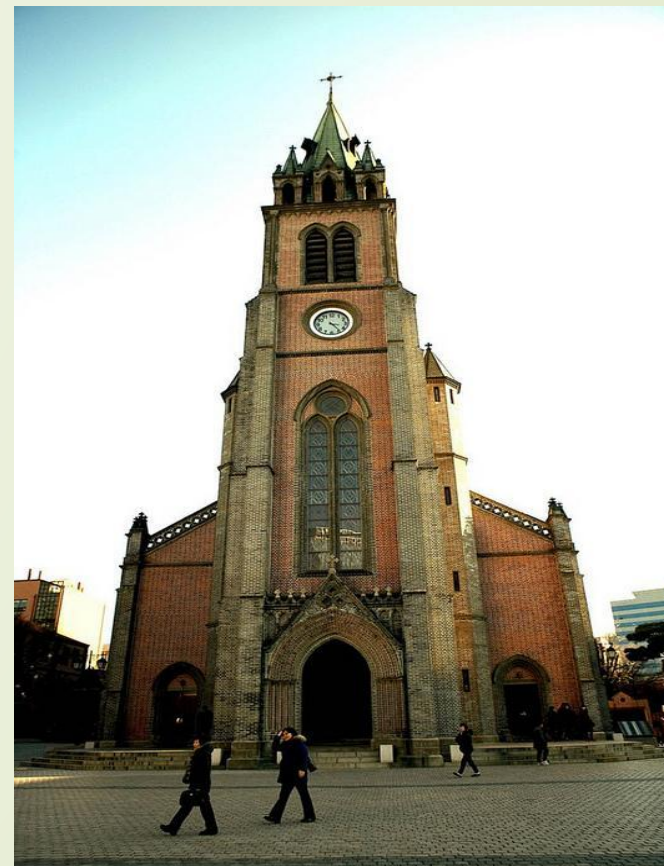
Католический собор Мендон