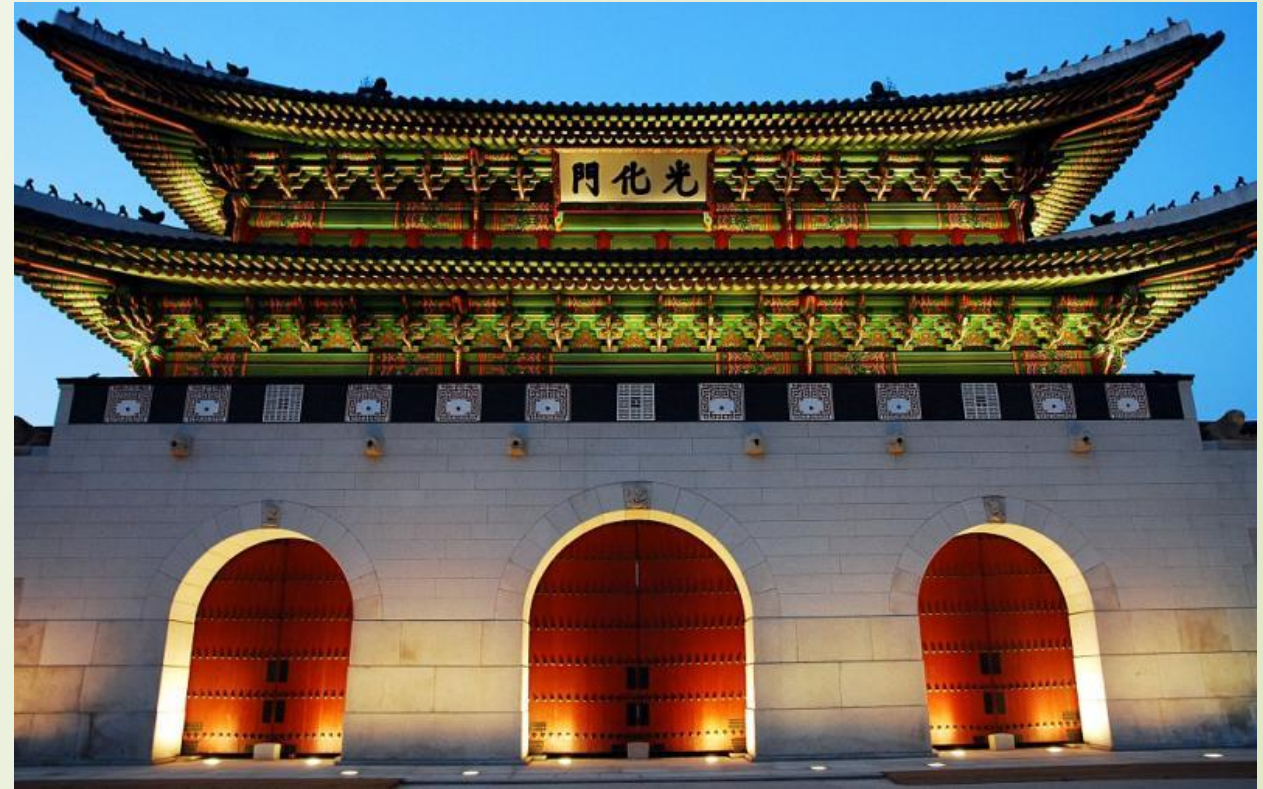
Королевский дворец Кёнбоккун