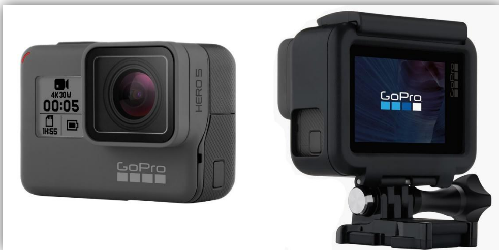
GoPro HERO5 Black