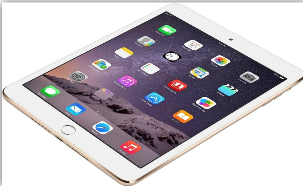
Apple iPad mini 4 64Gb Wi-Fi + Cellular