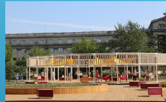
площадь Революции, Красноярск, Россия