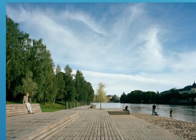
Набережная в г. Дивногорске, Россия