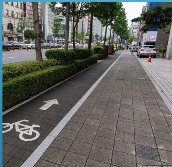
Сеул, Южная Корея