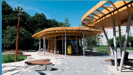
парк «Дубрава», Казань