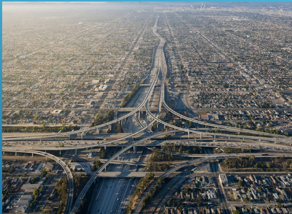
Пригородные районы Лос-Анджелеса