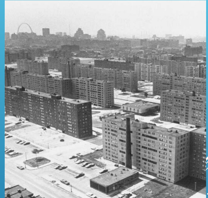
Сент-Луис в штате Миссури, район Прюитт-Айгоу