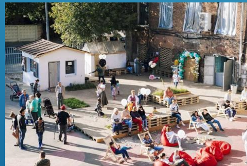
лофт-пространство на хлопкопрядильной фабрике, Балашиха, Москва