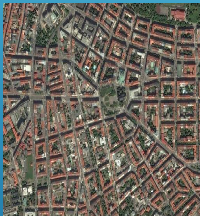
Правильная планировка городской среды