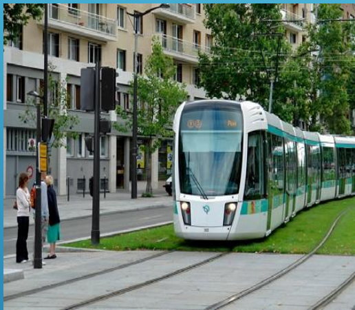
г. Париж, Франция