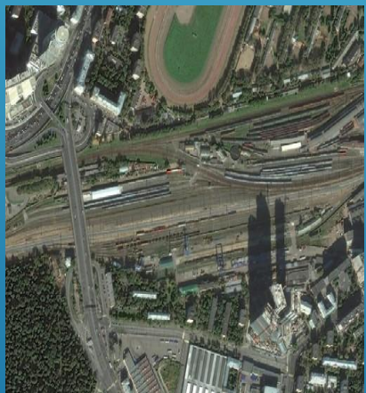
Неправильная планировка городской среды