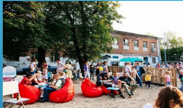
лофт-пространство на хлопкопрядильной фабрике, Балашиха, Москва