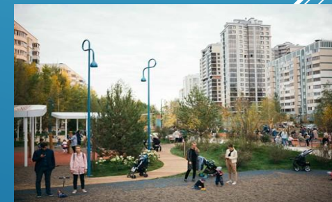
бульвар Белые цветы, Казань