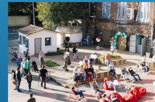
лофт-пространство на хлопкопрядильной фабрике, Балашиха, Москва