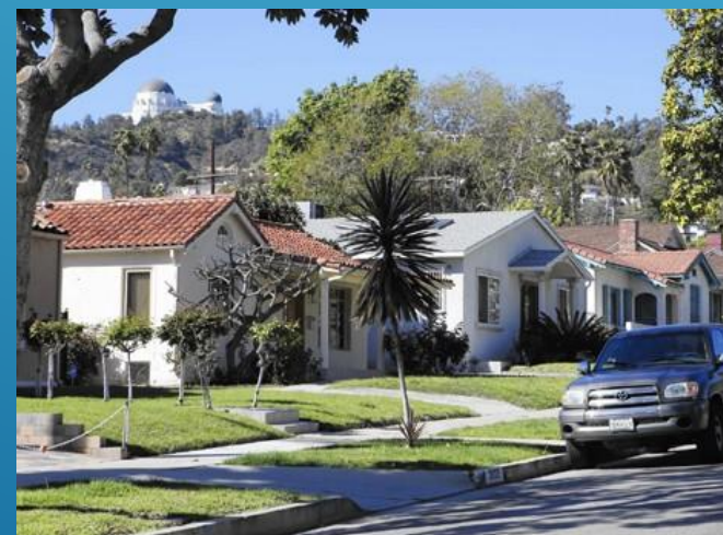
Пригородные районы Сан-Франциско