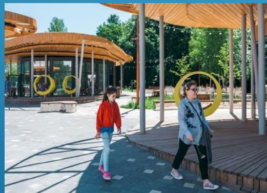
парк «Дубрава», Казань, Россия