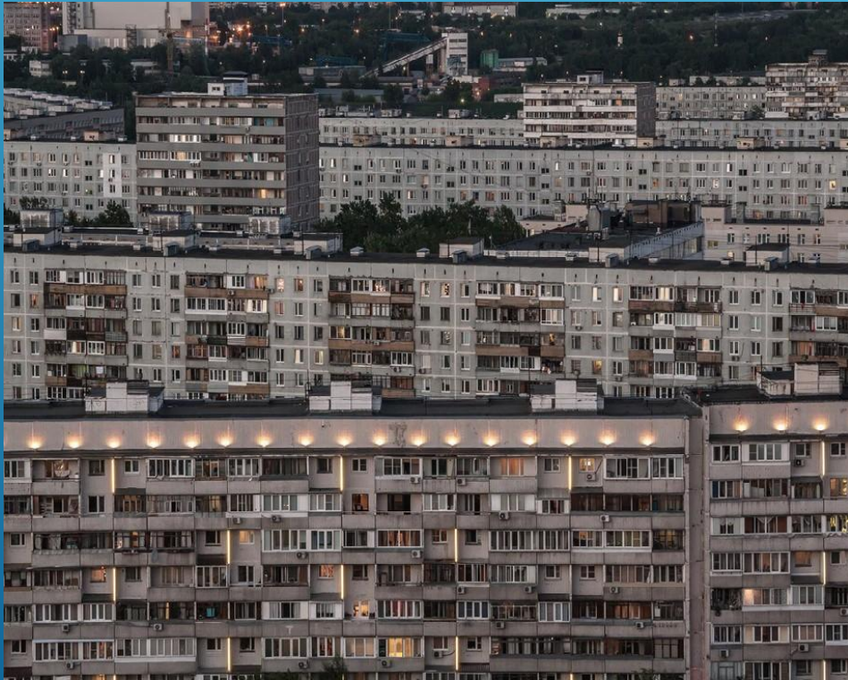
Панельная застройка г. Москва