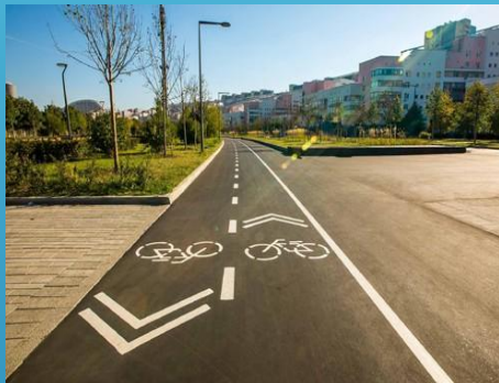
парк на Ходынском поле, Москва