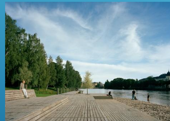
Набережная в г. Дивногорске, Россия