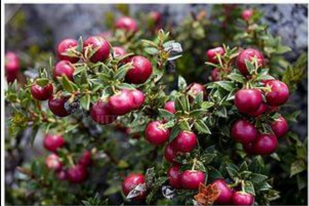
© Brad Schiller / Pappalardo, South America, January 2017 Landscape Images, LLC, San Francisco, CA