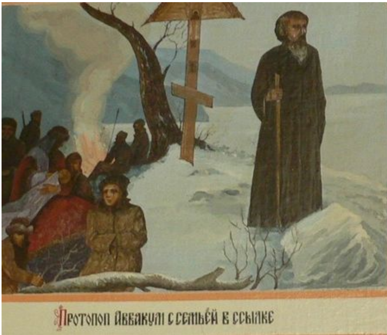
Протопоп Аввакум с семьёй в ссылке