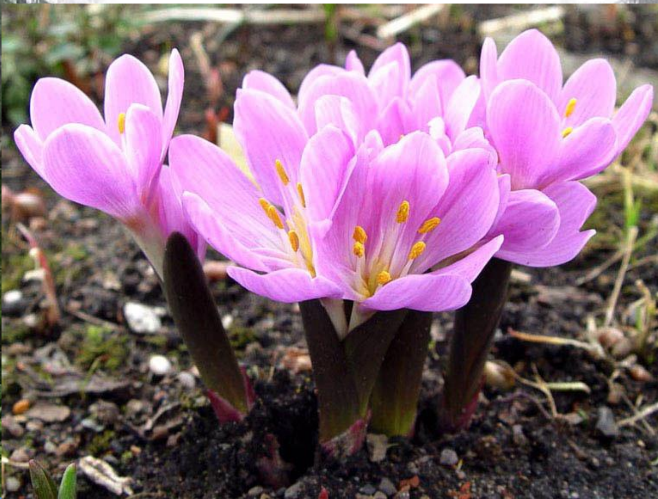
Брандушка разноцветная – Bulbocodium versicolor