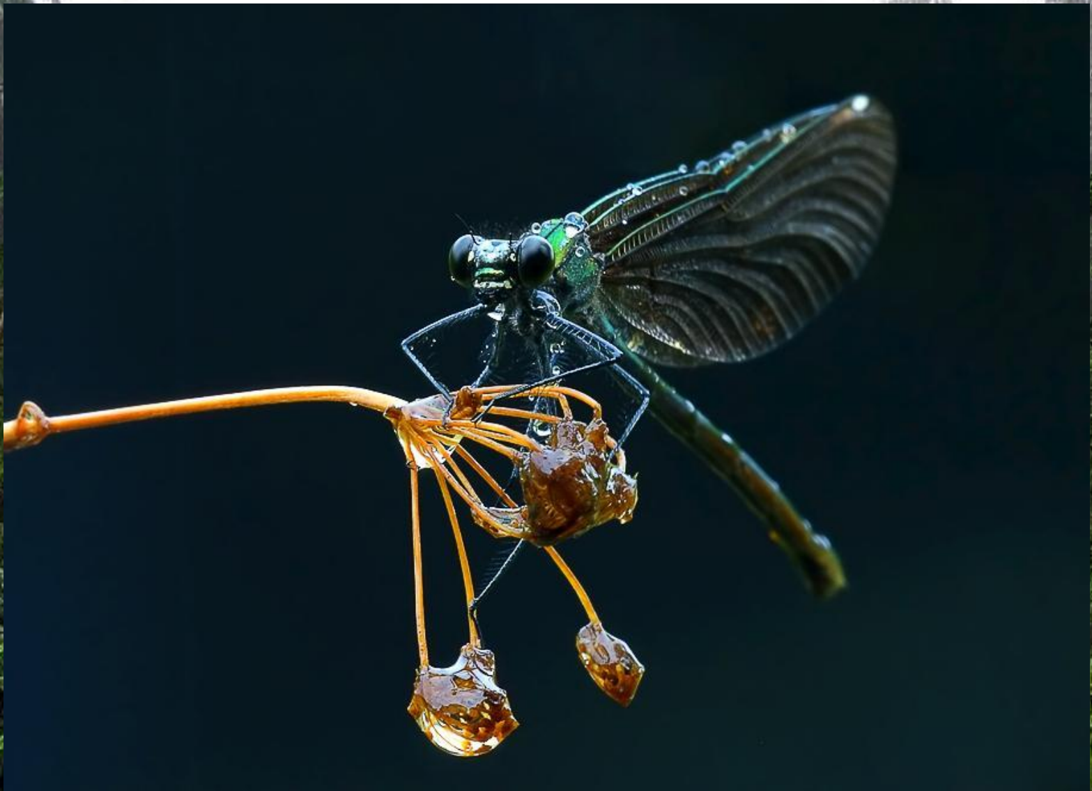
Красотка-девушка – Calopteryx virgo