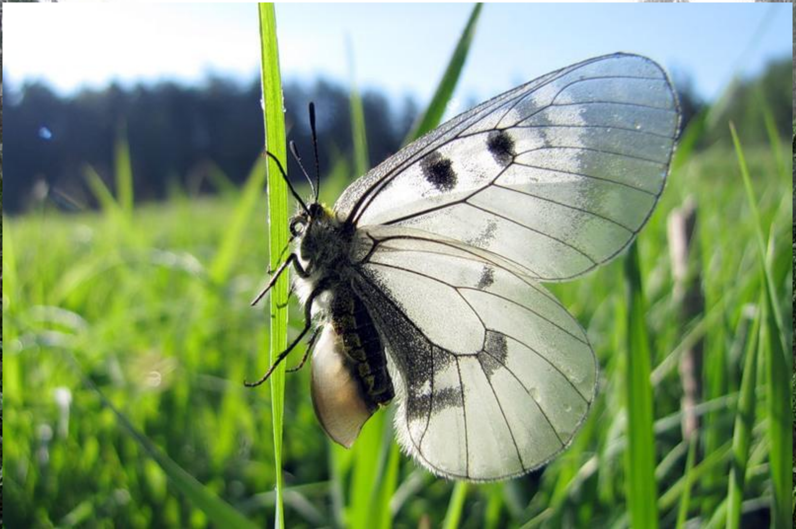
Мнемозина – Parnassius mnemosyne