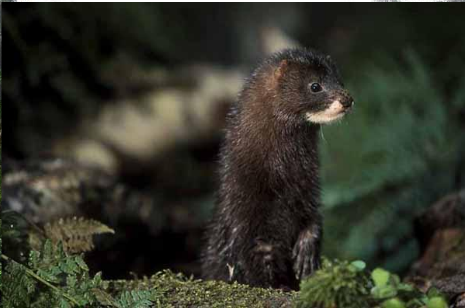
Европейская норка – Mustela lutreola