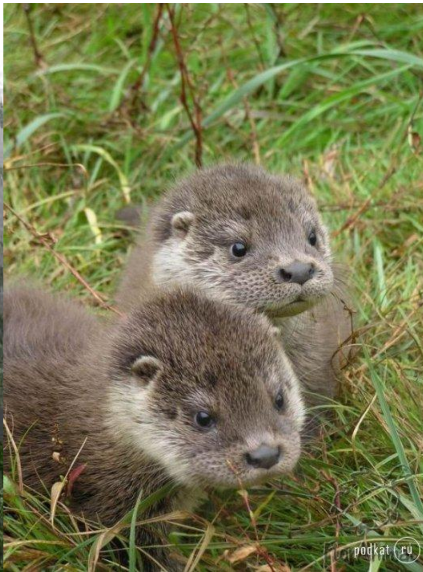
Выдра – Lutra lutra