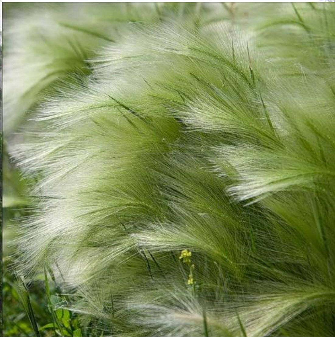
Ковыль перистый – Stipa pennata