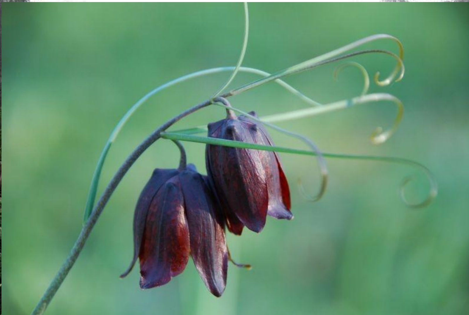
Рябчик русский – Fritillaria ruthenica Wikstr