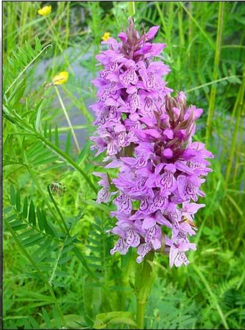
Ятрышник шлемовидный – Orchis militaris