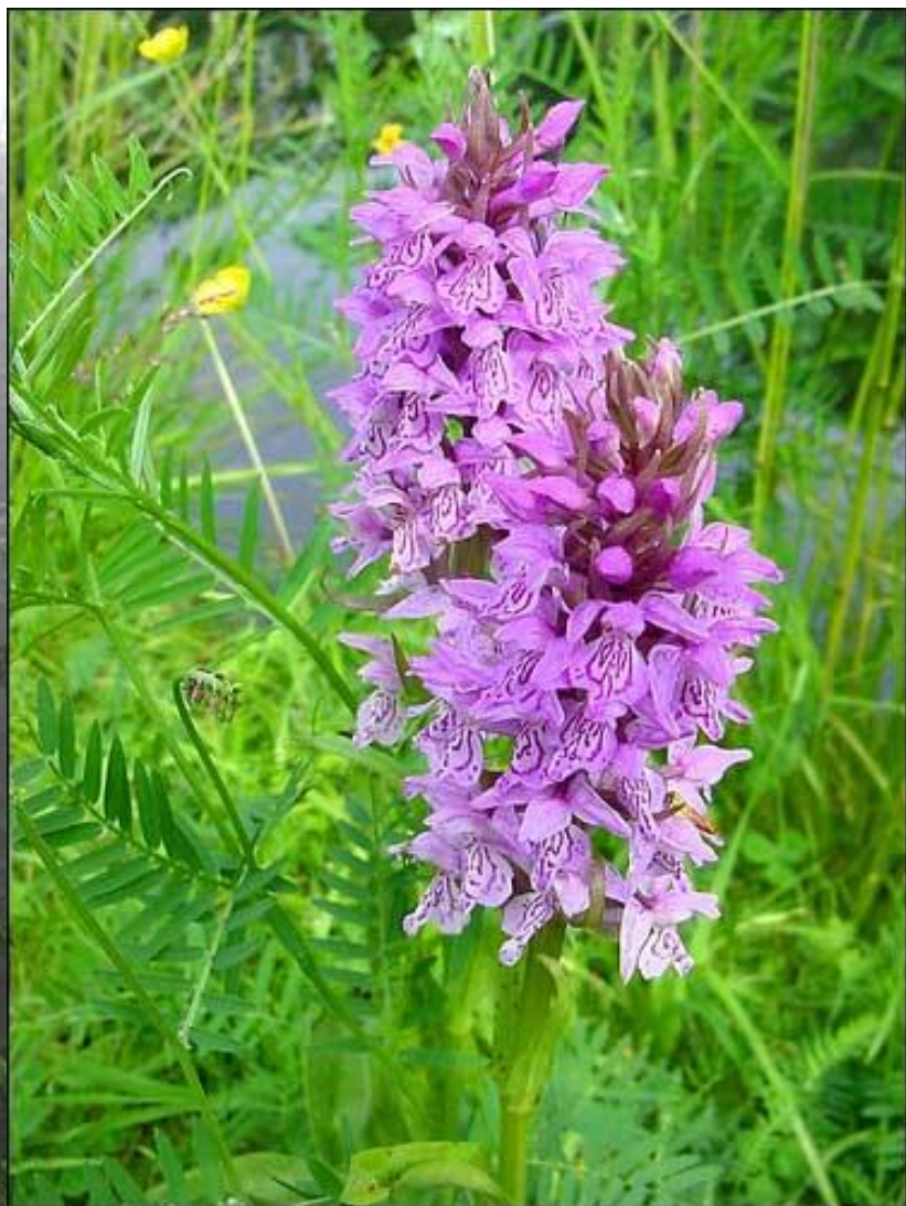
Ятрышник шлемовидный – Orchis militaris