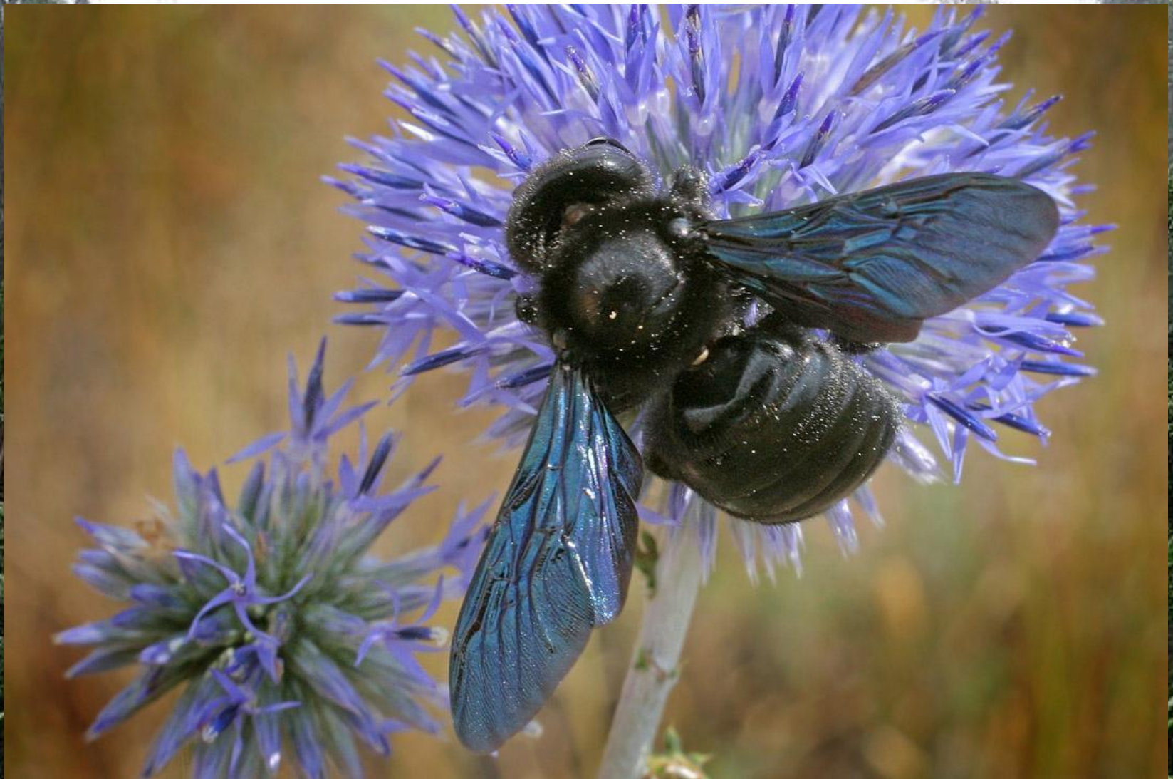
Пчела-плотник – Xylocopa valga