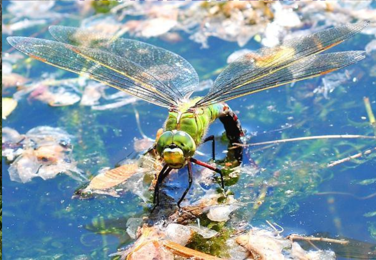
Дозорщик-император – Anax imperator Leach