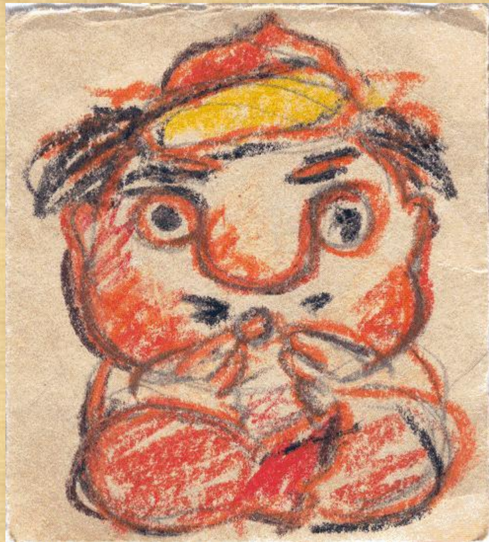
Соловей - разбойник

«Традиционные» русские исторические песни - написанные былинным стихом (а не стихом силлабо-тоническим, то есть основанном на строгом количестве слогов и рифме) и исполняемые в модалных (а не в тональных - мажоре и миноре) ладах. До XVII в. для русской культуры "поэтическое" и "песенное" были синонимами. Тексты либо пелись и были одновременно поэзией (былины, песни, молитвы), либо говорились (законодательные акты, например). Позднее противопоставление пения и не-пения сменилось противопоставлением стиха (петь который уже не обязательно, хотя и возможно) и прозы. К концу XIX в. песни "традиционного" типа были вытеснены силлабо-тоническими песнями, то есть, проще говоря, "современными", привычными нам рифмованными песнями.