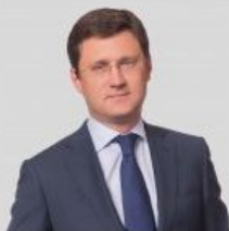
Новак Александр Валентинович