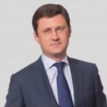
Новак Александр Валентинович