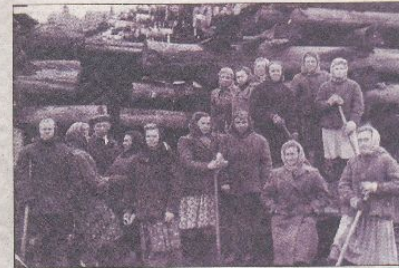
Женщины у штабеля стройматериалов.

Владимир Герман и Рафил Нуфман показали молодежи места расположения землянок. Еще сохранились ямы со стенами, приспособ-