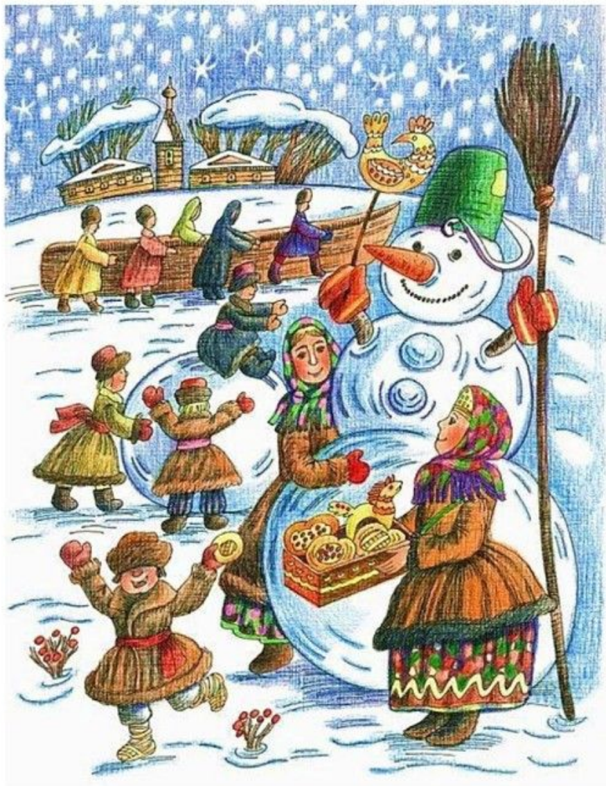
Архангельский Снеговик Архангельск