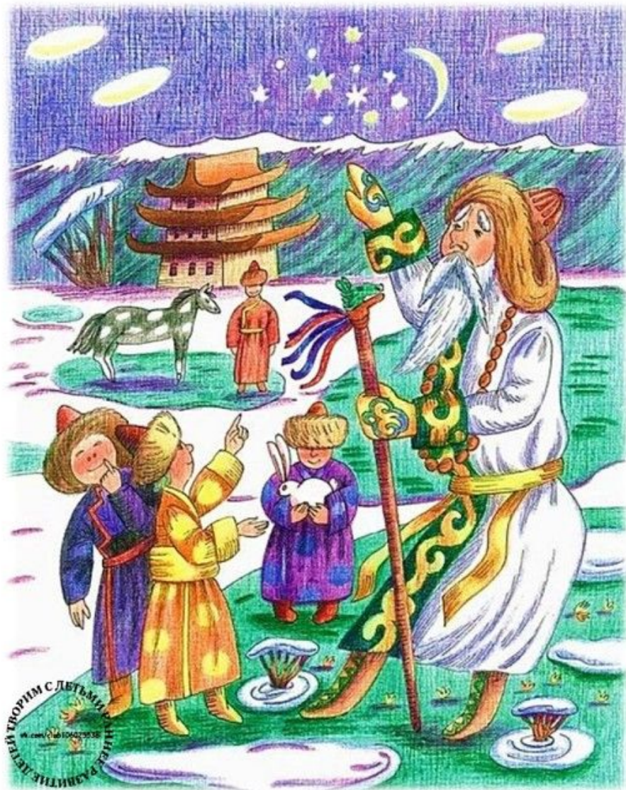
Сагаан Убугун Бурятия, Калмыкия