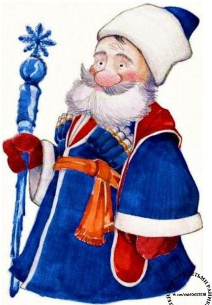
Всемирный Казачий Дед Мороз Россия