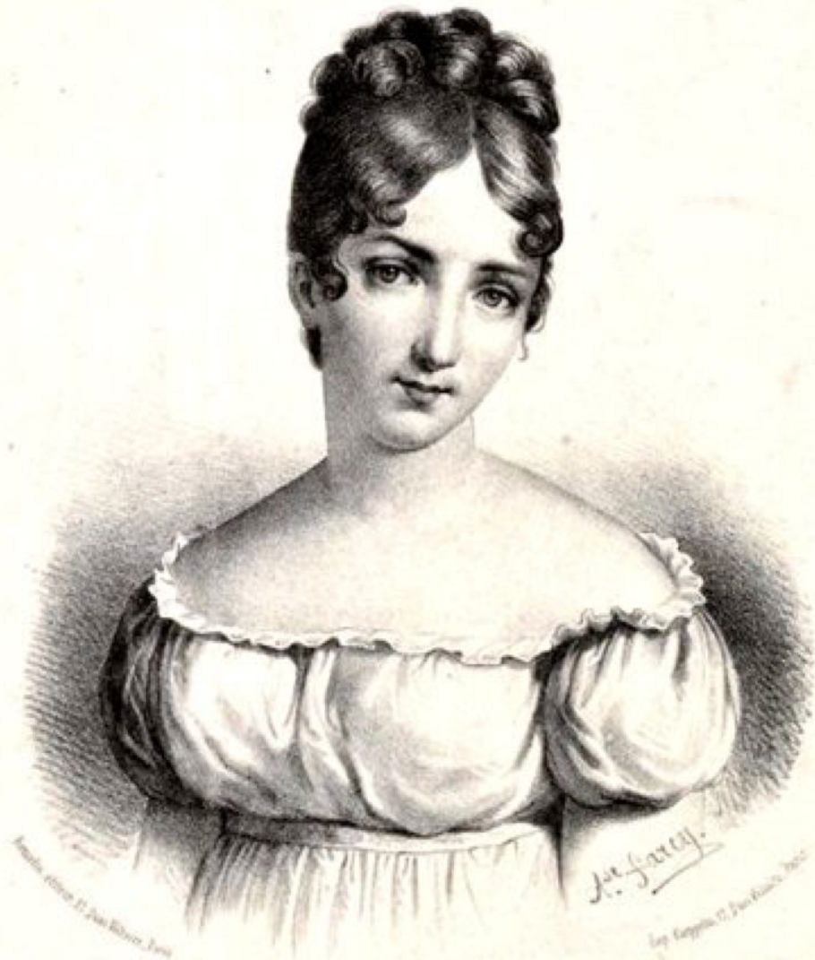
M me Récamier

Ее первой загадкой стало таинственное замужество. Ей было всего пятнадцать, когда она вышла замуж за Жака Рекамье, богатого банкира, старше ее на 27 лет. Романтически настроенные писатели полагают, что это был ее отец, влюбившийся много лет назад в очаровательную мадам Бернар - мать Жюли, а в 1777 году от этой связи родилась чудесная девочка, унаследовавшая от матери красоту и хороший вкус, а от отца ум, и превратившаяся в первой половине XIX века в одну из самых очаровательных женщин Франции.