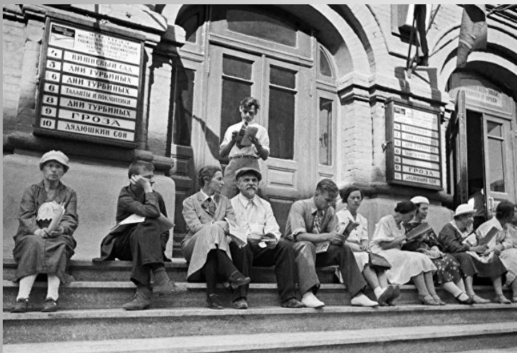
У входа в Московский Художественный академический театр имени А.П.Чехова, 1930-е