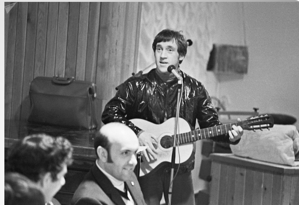
Владимир Высоцкий (1938-1980) во время празднования 10-летия Театра на Таганке.