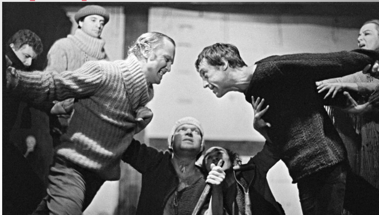
Владимир Высоцкий в роли Гамлета, Александр Пороховщиков в роли Клавдия