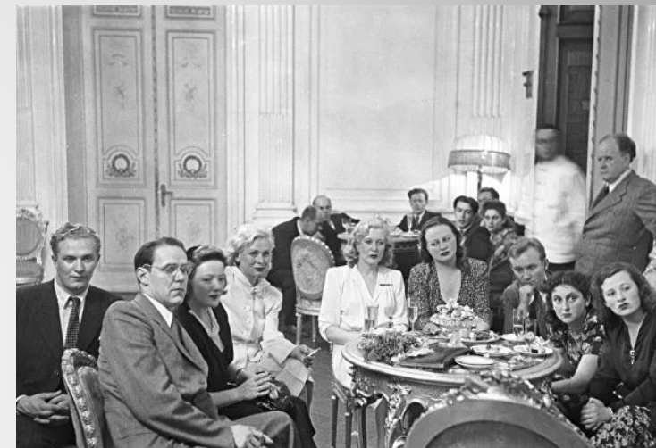
Франческа Гааль в гостях у артистов советского кинематографа. Москва, 1945.