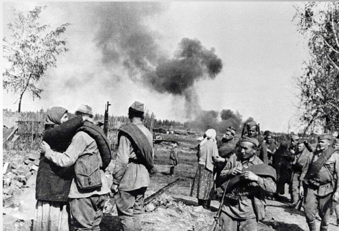
Освобождение захваченного фашистами села, 1943 год.