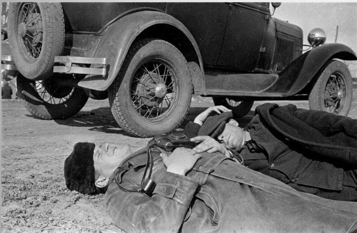
Перед вылетом на задание, 1943 год