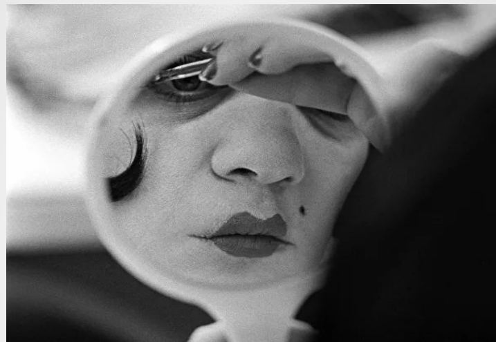
Актриса театра "Современник" Галина Волчек в гримерной, 1975.