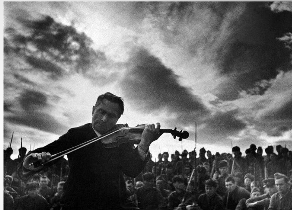
Выступление артистов перед бойцами, 1942 год