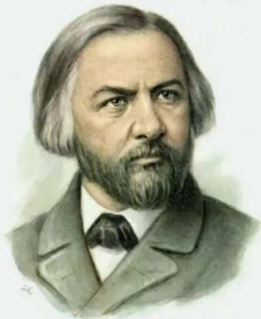
М.И.ГЛИНКА (1840 – 1893)

«СОЗДАЁТ МУЗЫКУ НАРОД, А МЫ ХУДОЖНИКИ ТОЛЬКО ЕЁ АРАНЖИРУЕМ»