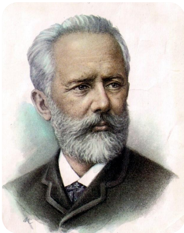
П.И. ЧАЙКОВСКИЙ (1840 – 1893)