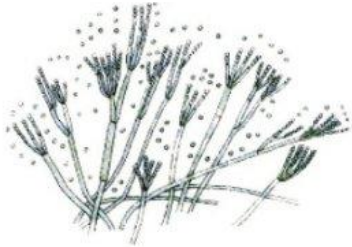
Размножение спорами пеницилла