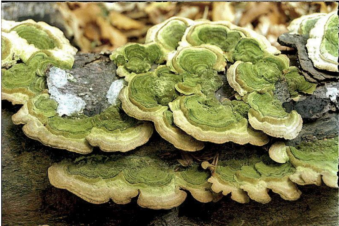
Гриб трутов ИК