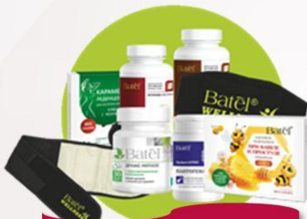
Продукция для здоровья