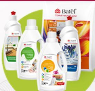
Средства для дома