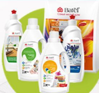
Средства для дома