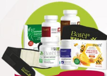
Продукция для здоровья