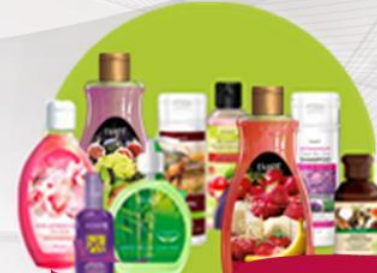
Средства повседневного ухода