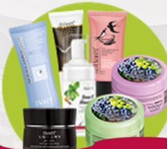
Косметика для ухода за кожей