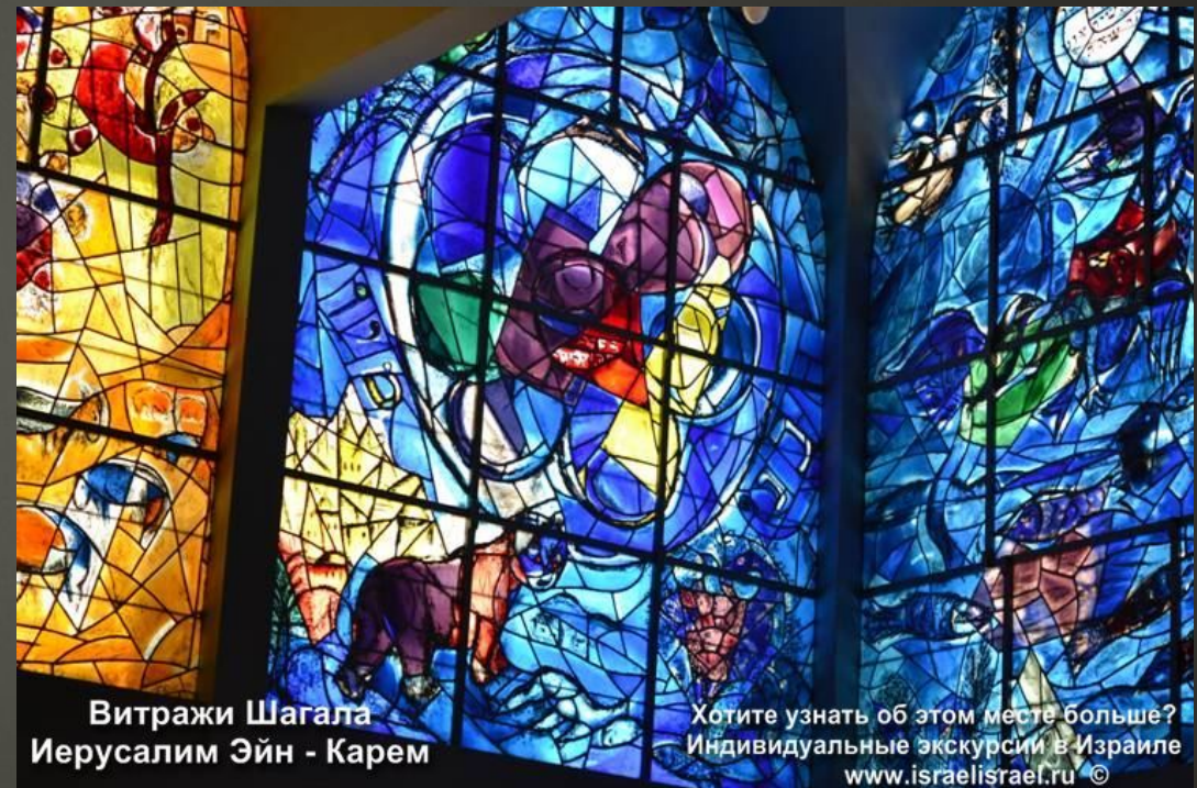
Витражи Шагала Иерусалим Эйн - Карем

Хотите узнать об этом месте больше? Индивидуальные экскурсии в Израиле www.israelisrael.ru ©