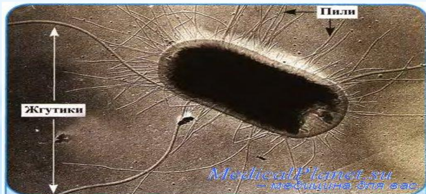
Рис. 3.42. Жгутики и пили кишечной палочки. Электроннограмма бактерии, напыленной металлом

Дифференциация эшерихий проводится на основании антигенной структуры. Различают капсульные антигены (К) трех разновидностей (А, В и L), соматические О-антигены и жгутиковые Н-антигены. Известно 100 вариантов капсульных антигенов, 163 О-антигенов и 56 Н-антигенов