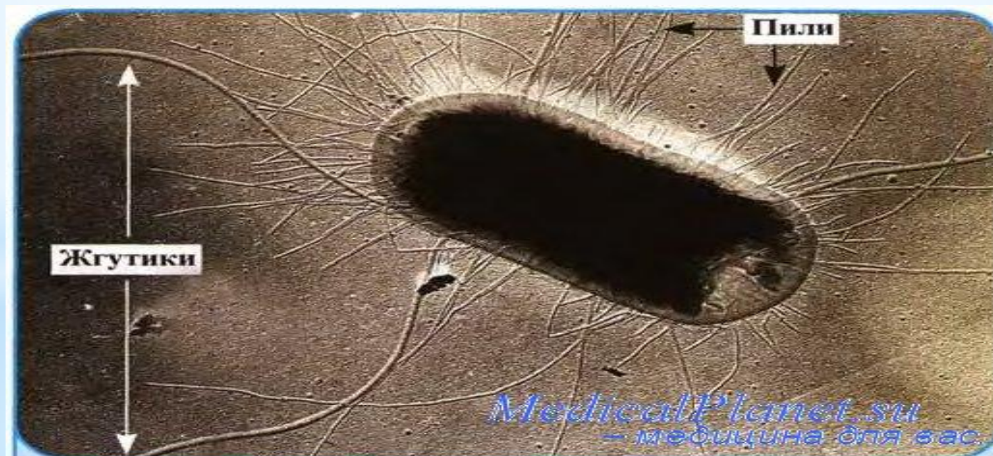
Рис. 3.42. Жгутики и пили кишечной палочки. Электроннограмма бактерии, напыленной металлом

Дифференциация эшерихий проводится на основании антигенной структуры. Различают капсульные антигены (К) трех разновидностей (А, В и L), соматические О-антигены и жгутиковые Н-антигены. Известно 100 вариантов капсульных антигенов, 163 О-антигенов и 56 Н-антигенов