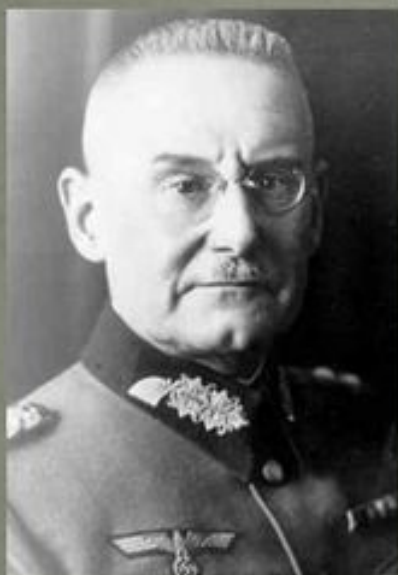
Франц Гальдер (1884-1972).

«Своеобразие страны и своеобразие характера русских придает кампании особую специфику. Первый серьезный противник ».