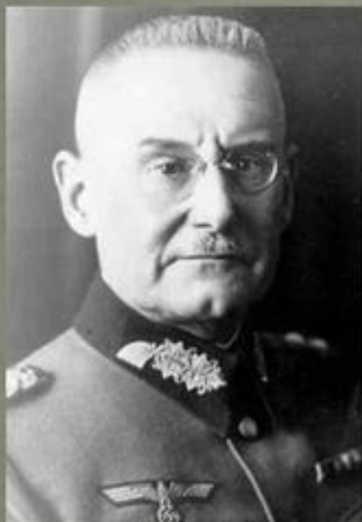
Франц Гальдер (1884-1972).

«Своеобразие страны и своеобразие характера русских придает кампании особую специфику. Первый серьезный противник ».