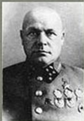
Генерал армии Д.Г.Павлов.