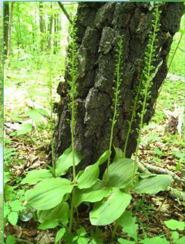
Зозулині сльози яйцевидні , одна з найпоширеніших в Україні орхідей.