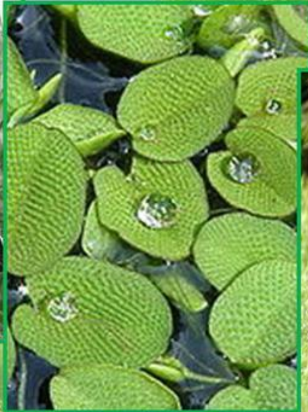
Сальвінія плаваюча, плаваюча папороть