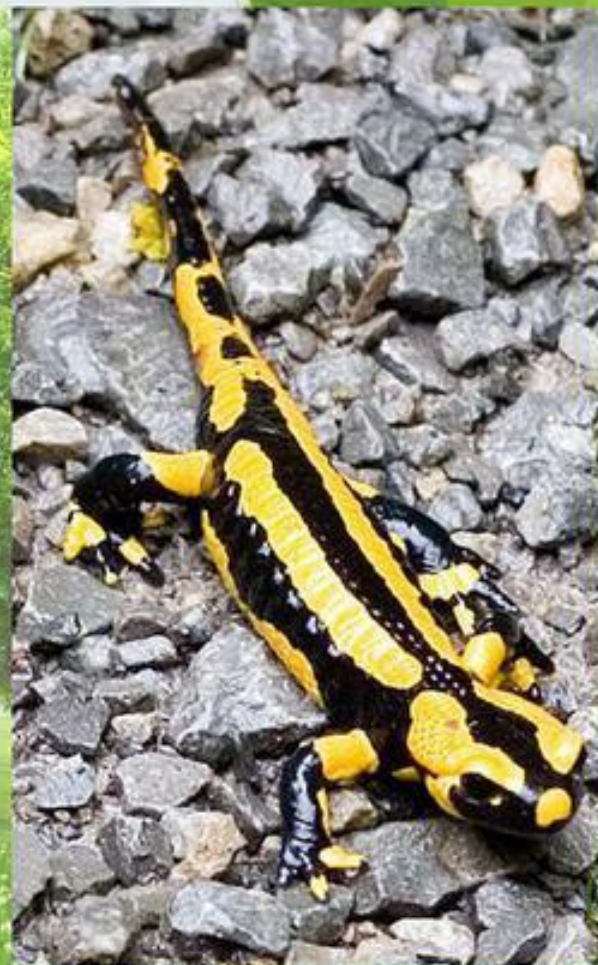
Вогняна або плямиста саламандра.