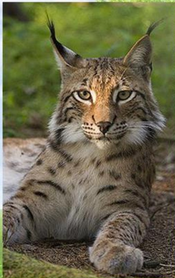
Євразійська або звичайна риць, зустрічається рідко: в Карпатах та на Поліссі.