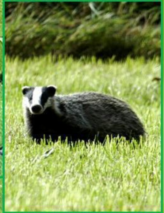
Борсук, вид звірів з родини кунцевих