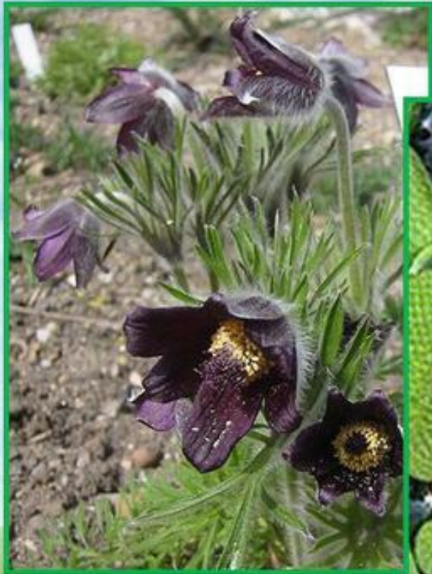
Сон-трава чорніюча, вид рослин з роду Сон родини Жовтцевих