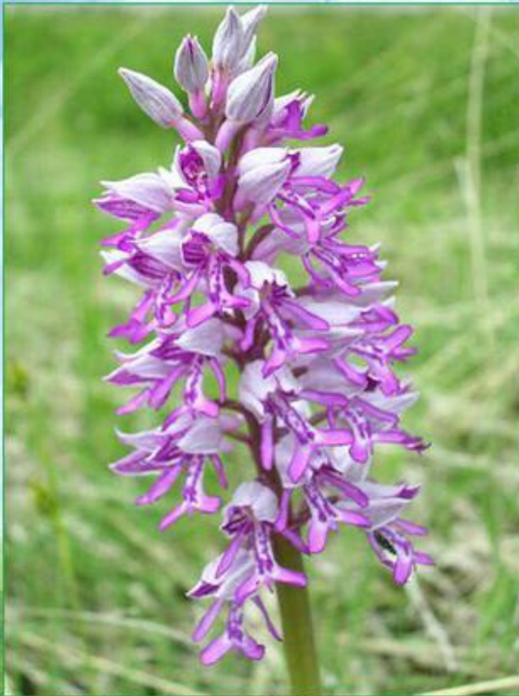
Зозулинець шоломоносний , рідкісна, зникаюча рослина. трапляється в Карпатах і на Прикарпатті,