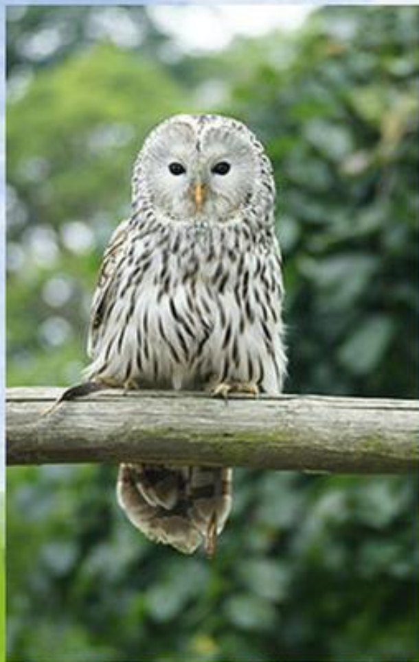
Сова довгохвоста, рідкісний гніздовий вид.