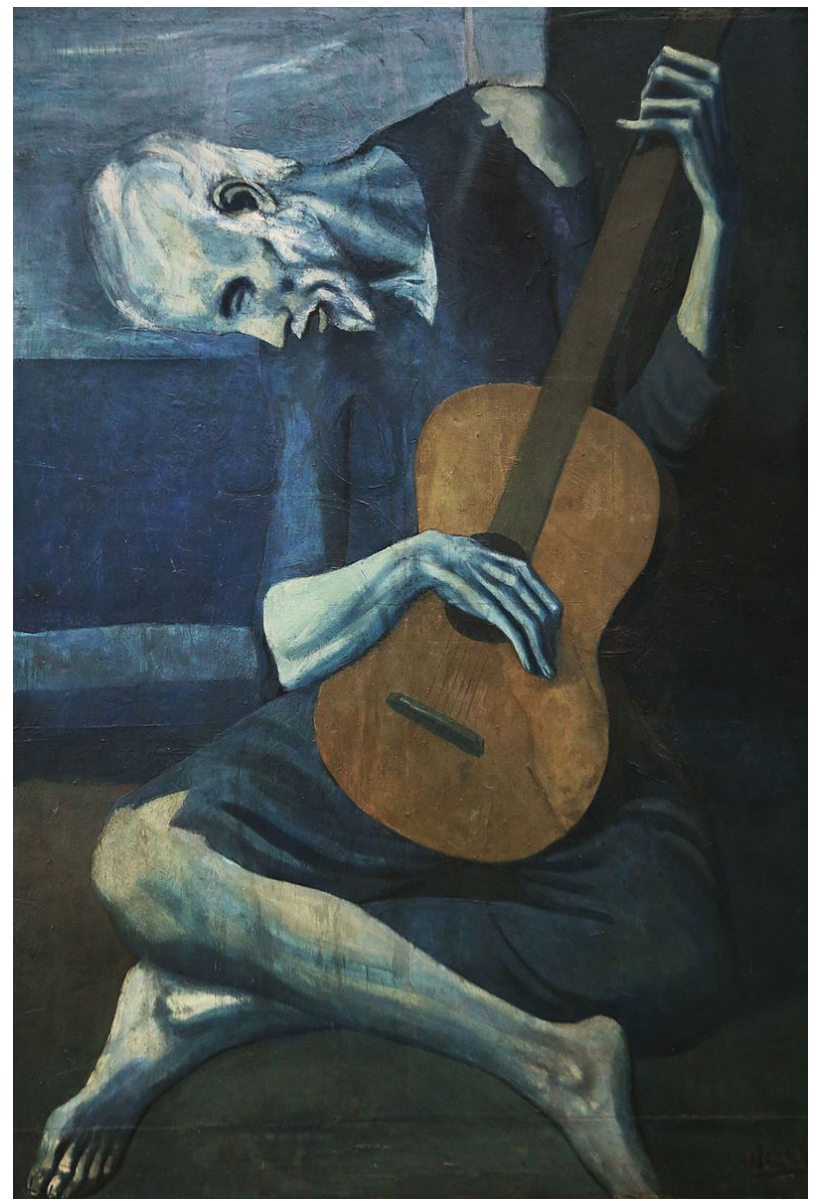
Pablo Picasso, The Old Guitarist (1903)