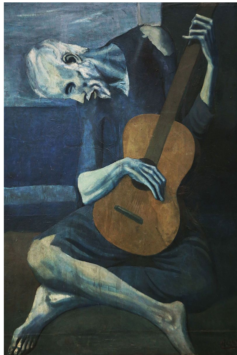
Pablo Picasso, The Old Guitarist (1903)