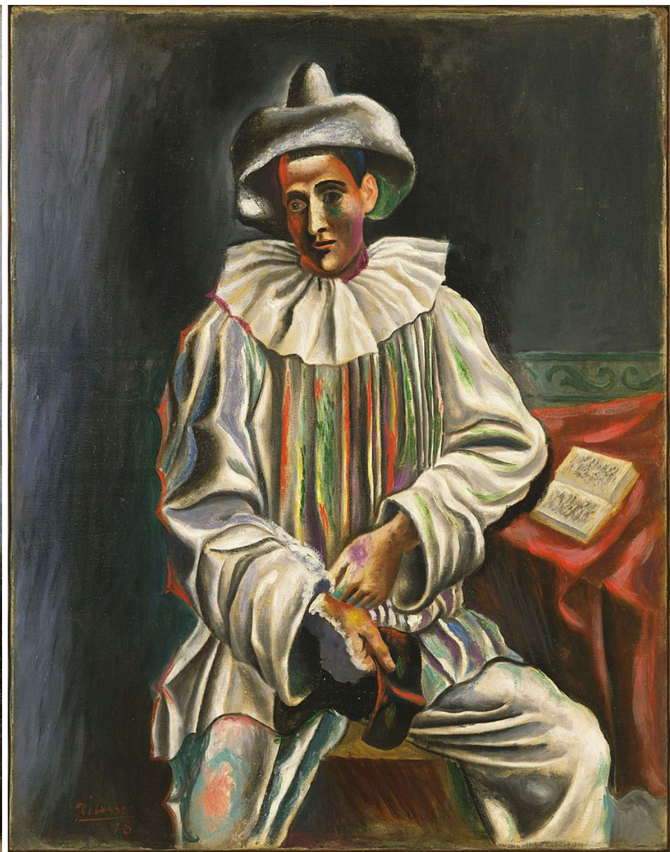
Pablo Picasso, 1918, Pierrot