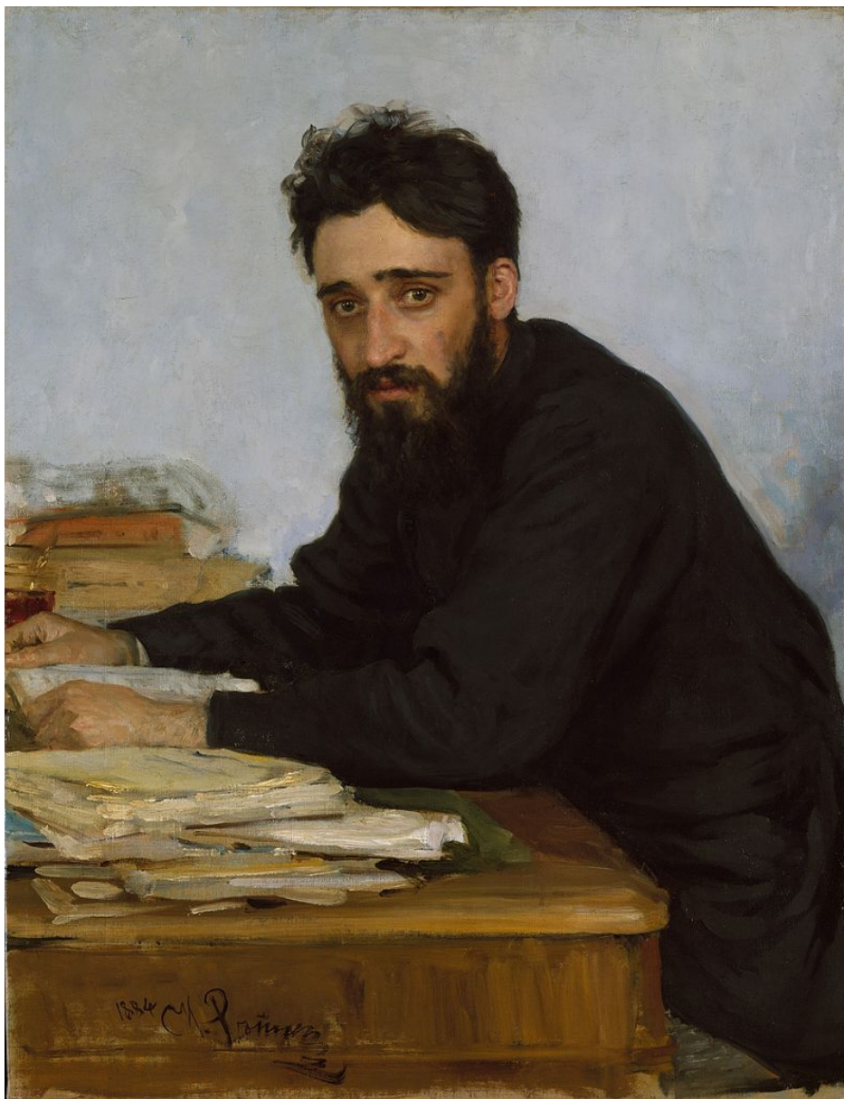
И. Е. Репин. Портрет Гаршина. 1884