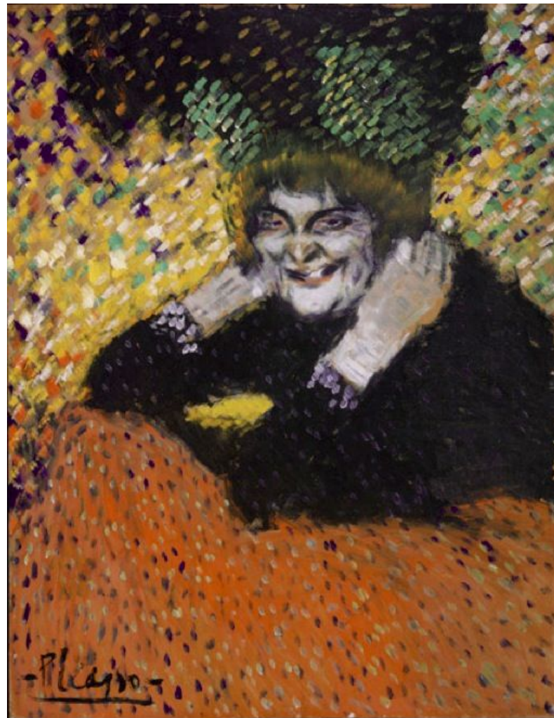
Pablo Picasso, 1901, Old Woman