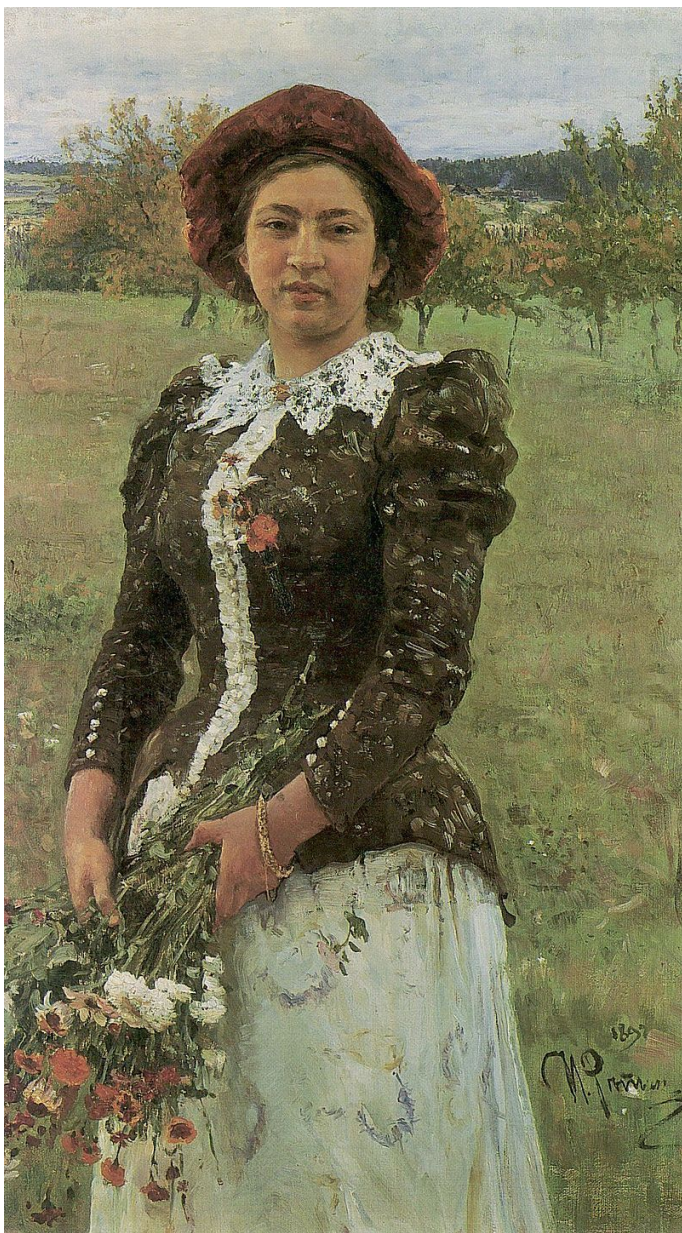
И. Е. Репин. Осенний букет. 1892