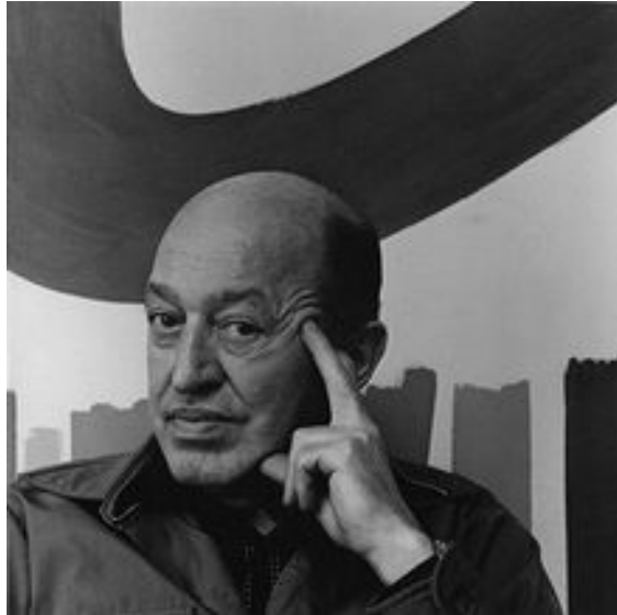
Клемент Гринберг (1909–1984)