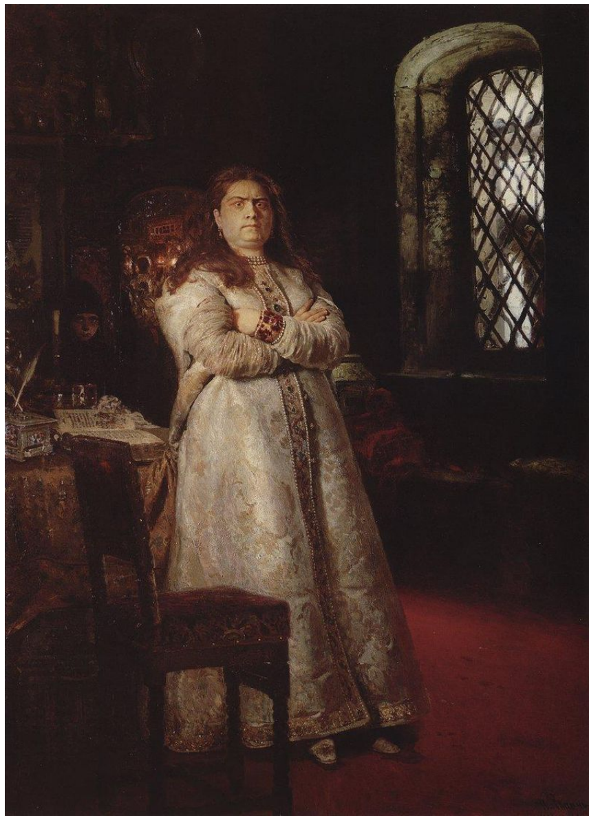
И. Е. Репин. Царевна Софья. 1879