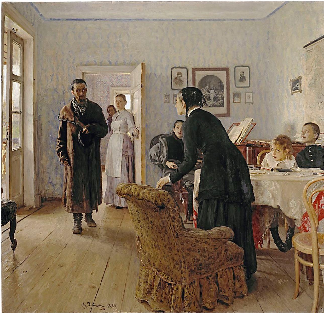
И. Е. Репин. «Не ждали». 1888