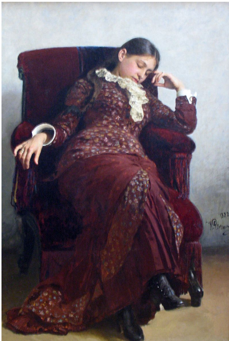
И. Е. Репин. Отдых. 1882