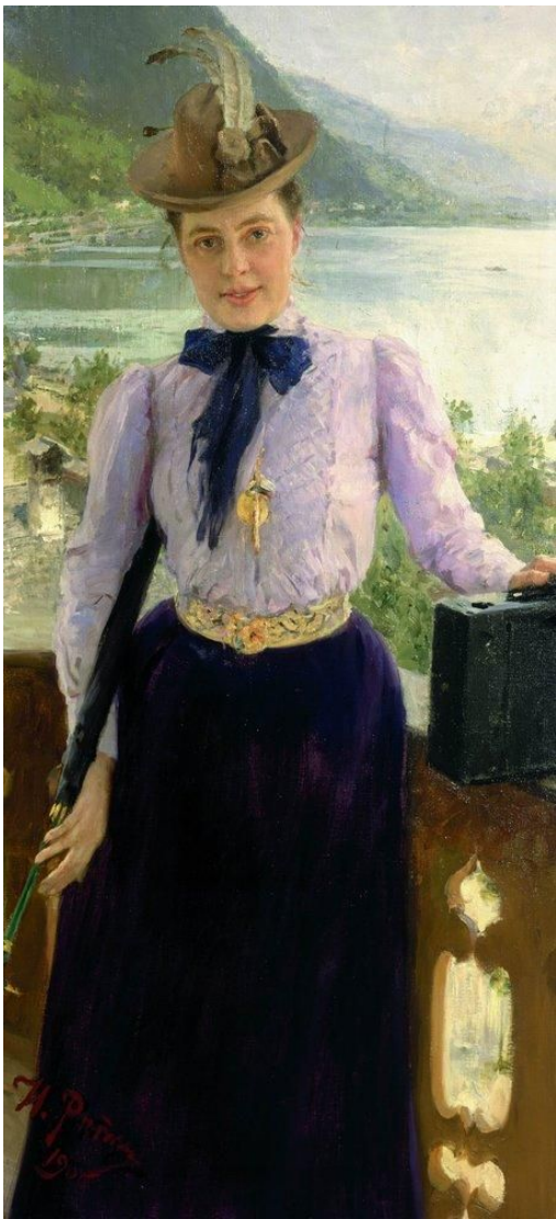
И. Е. Репин. Портрет писательницы Натальи Нордман-Северовой. 1900