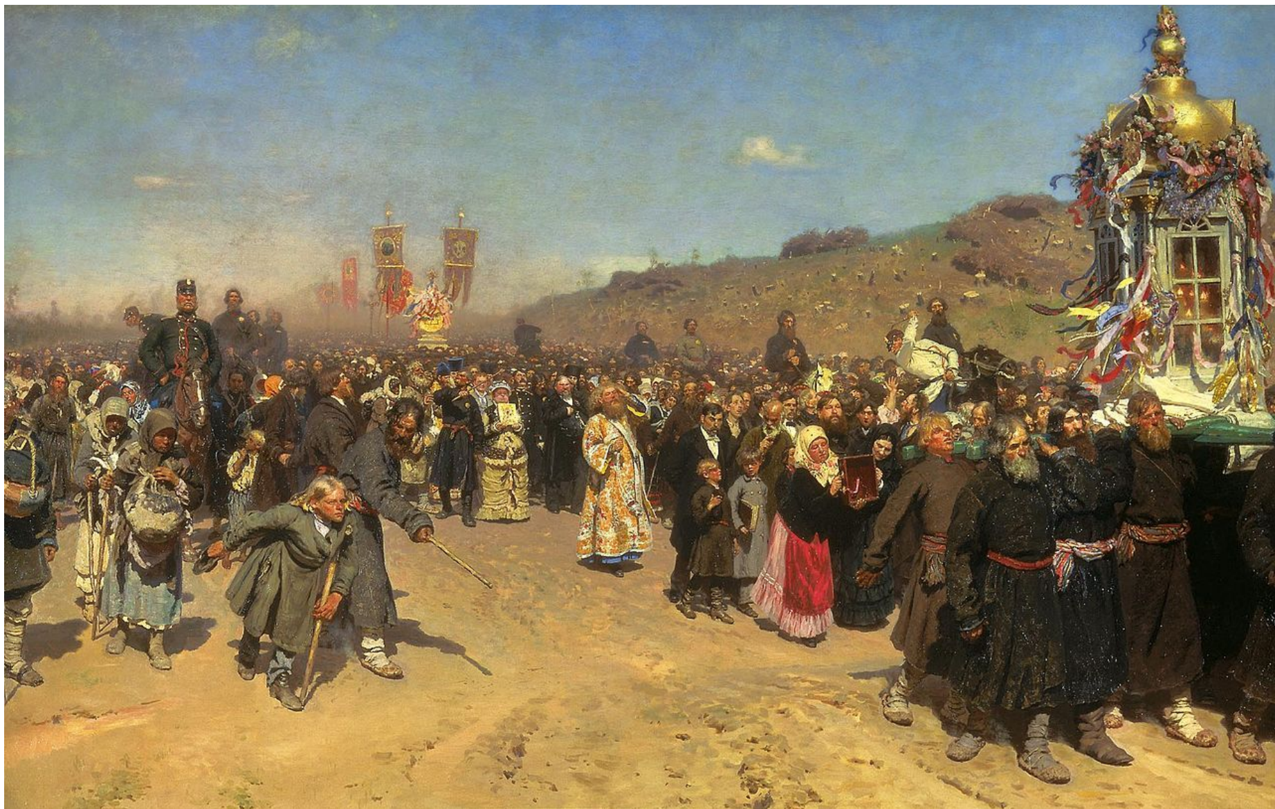
И. Е. Репин. Крестный ход в Курской губернии. 1883