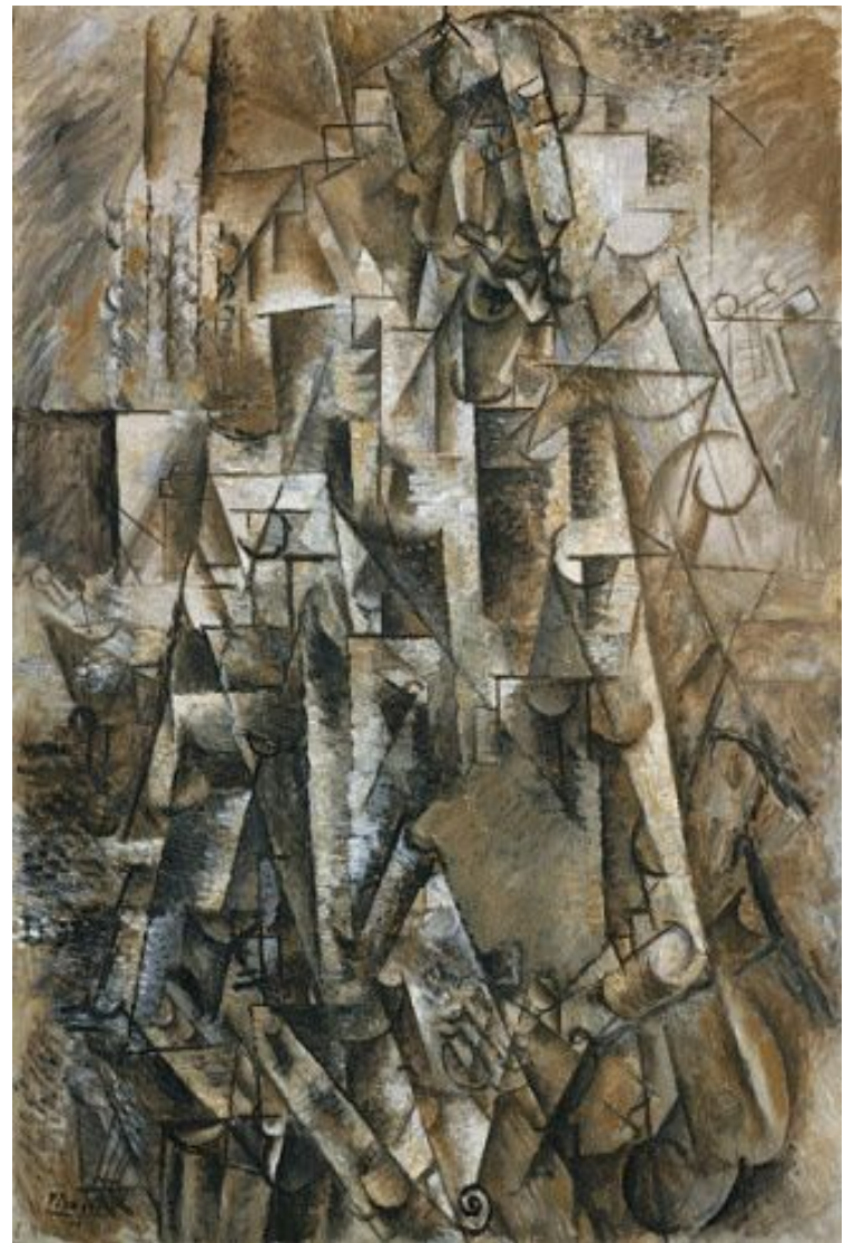
Pablo Picasso 1911, The Poet (Le poète)