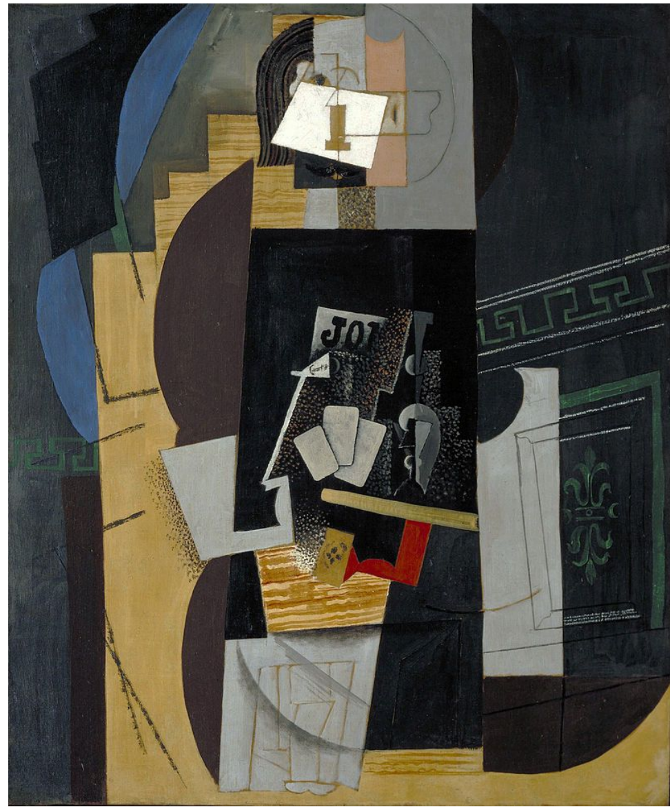
Pablo Picasso 1913-14, L'Homme aux cartes