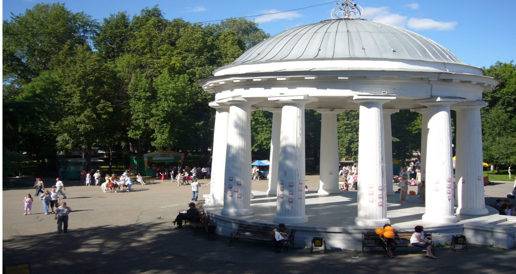
Пермский парк культуры и отдыха имени Горького