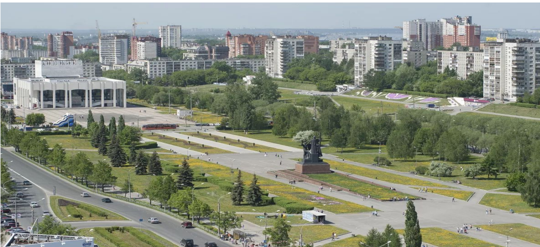
Музей истории Мотовилихинских заводов