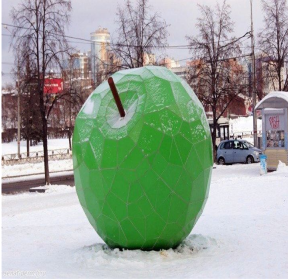
Пермский парк культуры и отдыха имени Горького