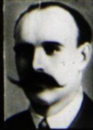
А. Я. Пархоменко.