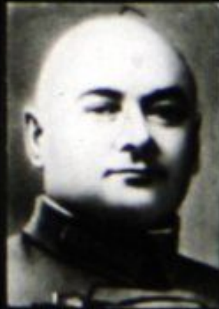
Г. И. Котовский.