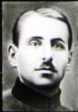
В. К. Блюхер.