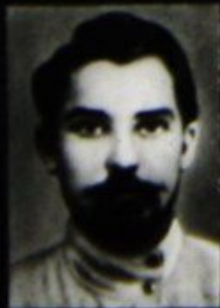
Н. А. Щорс.