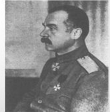
А. М. Каледин