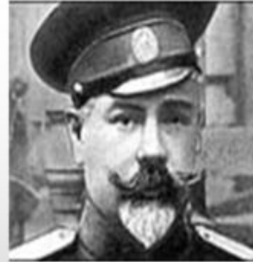
А. И. Деникин