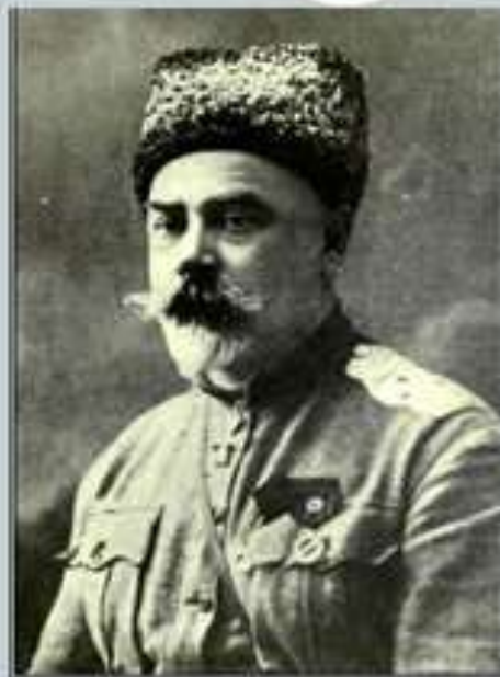
Деникин Антон Иванович