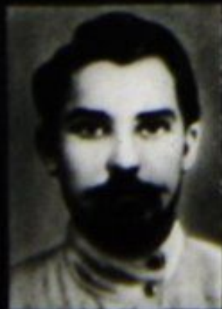
Н. А. Щорс.