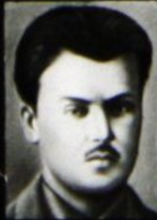
С. Г. Лазо.