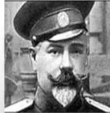
А. И. Деникин