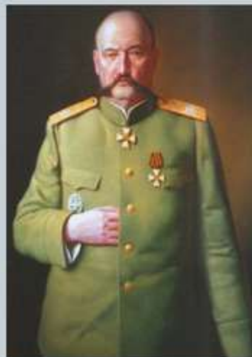
Николай Николаевич Юденич