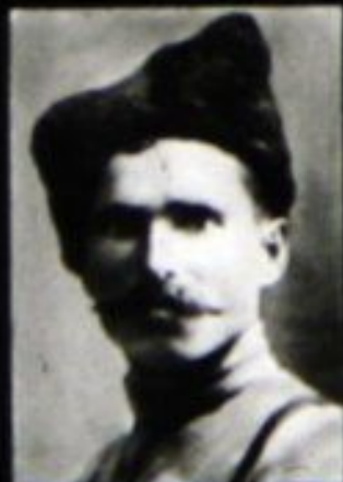
В. И. Чапаев.

Из рядов Коммунистической партии, из народа вышли многие герои гражданской войны и полководцы.