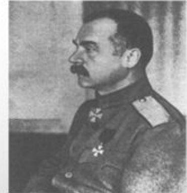
А. М. Каледин