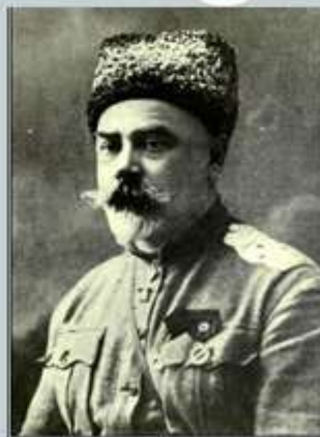
Деникин Антон Иванович