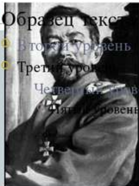
Корнилов Лавр Георгиевич