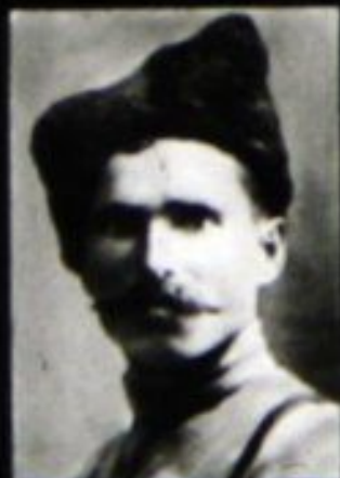
В. И. Чапаев.

Из рядов Коммунистической партии, из народа вышли многие герои гражданской войны и полководцы.