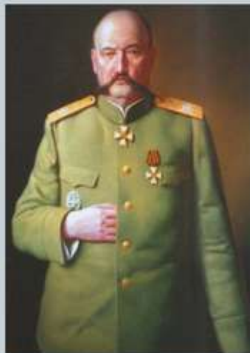
Николай Николаевич Юденич