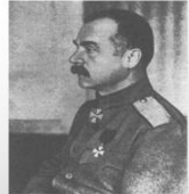
А. М. Каледин