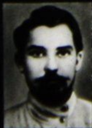
Н. А. Щорс.