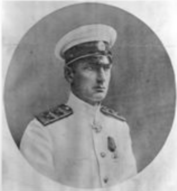
А. В. Колчак