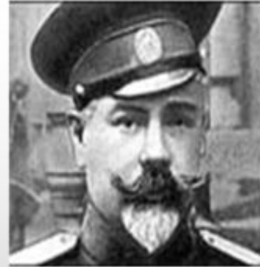
А. И. Деникин