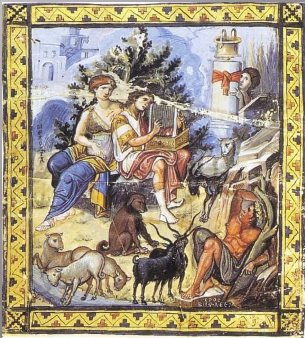
Миниатюры Парижской Псалтири (конец IX — начало X в.)