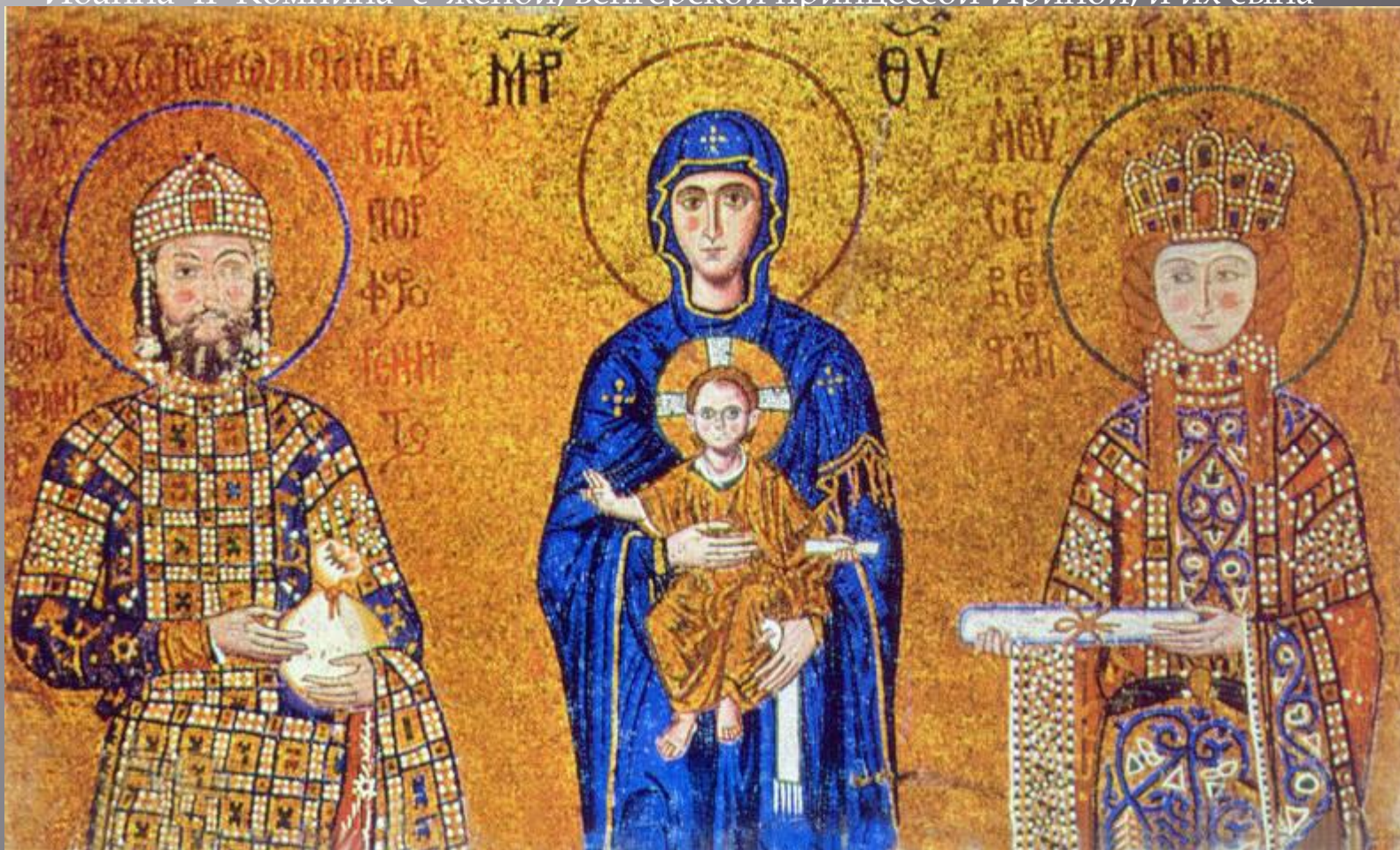
Император Иоанн II Комнин и императрица Ирина перед Богоматерью с Младенцем. XII в.