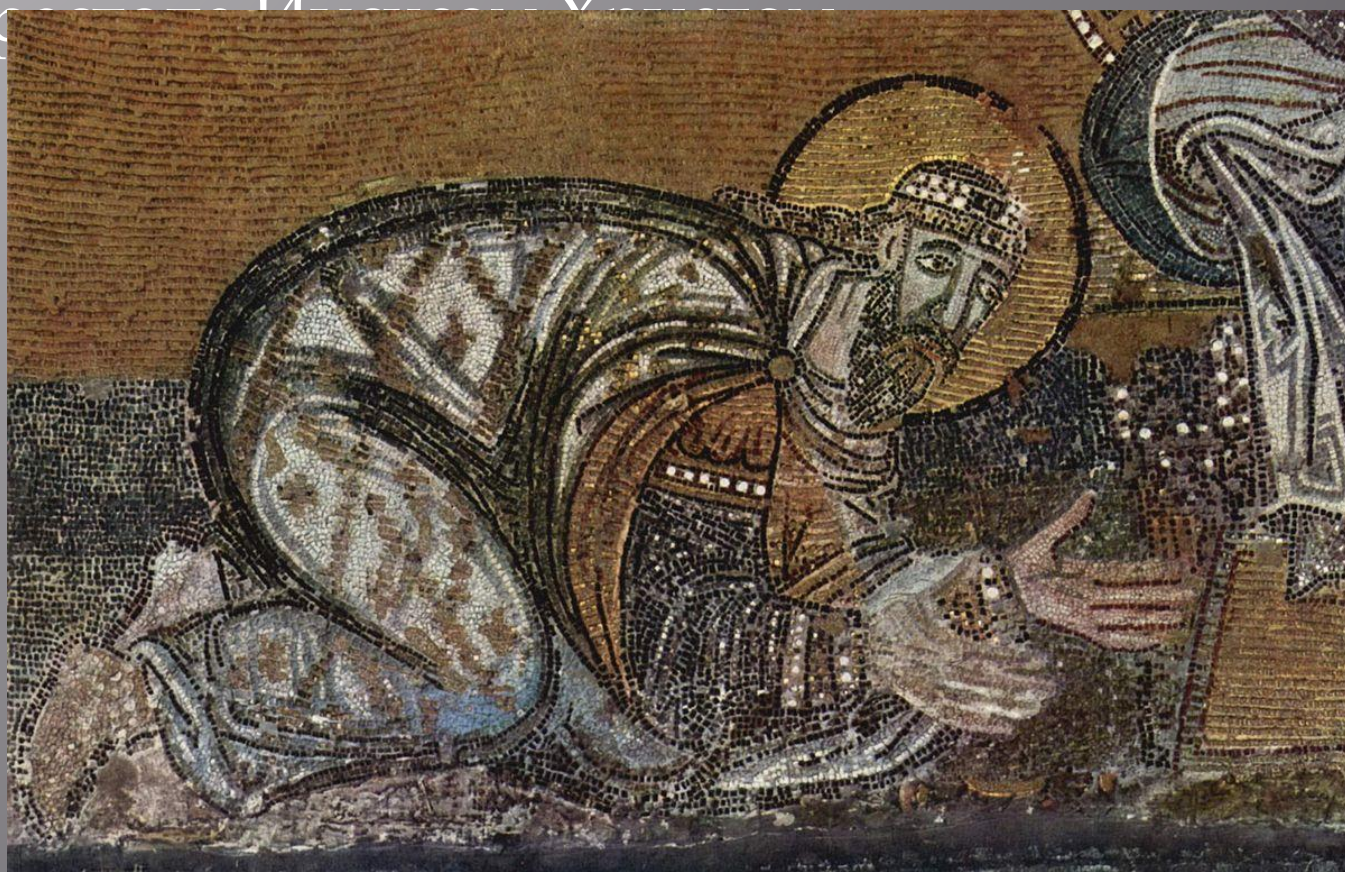
Император Лев VI перед Христом. Мозаика. IX в.