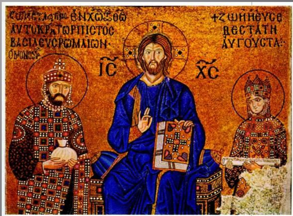
Император Константин Мономах и императрица Зоя перед Христом. Середина XI в.