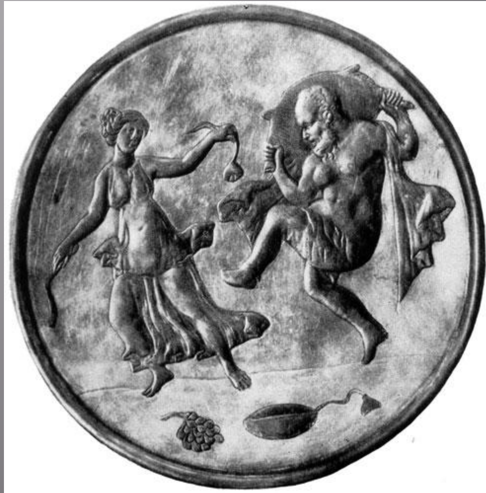
Серебряное блюдо с Силеном и Менадой. VII в.