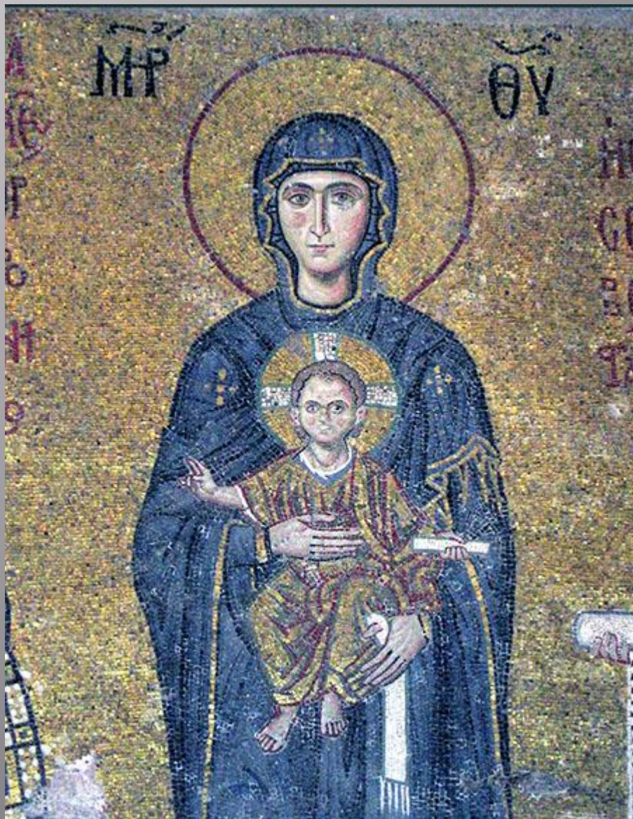
Император Иоанн II Комнин и императрица Ирина перед Богородицею с Младенцем. XII в.