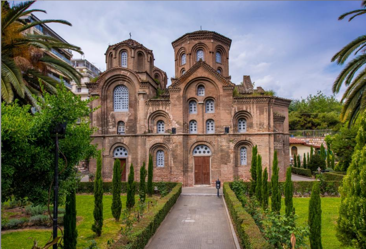
Храм Панагии Халкеон в Фессалониках (1028 г.)