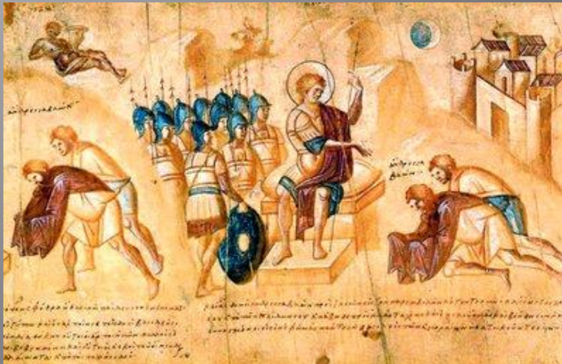
Иисус Навин и два соглядатая. Свиток Иисуса Навина. X в.