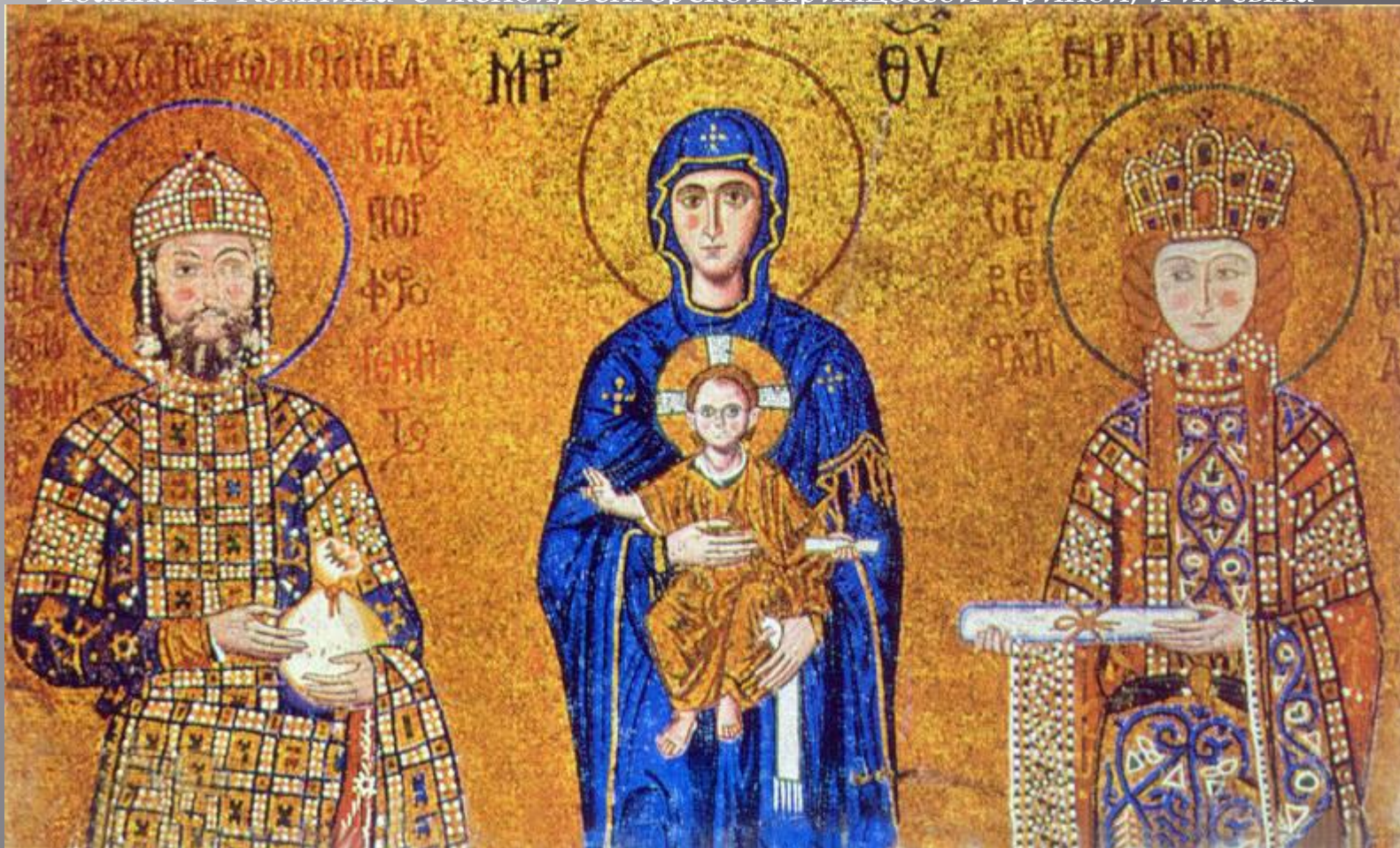
Император Иоанн II Комнин и императрица Ирина перед Богоматерью с Младенцем. XII в.