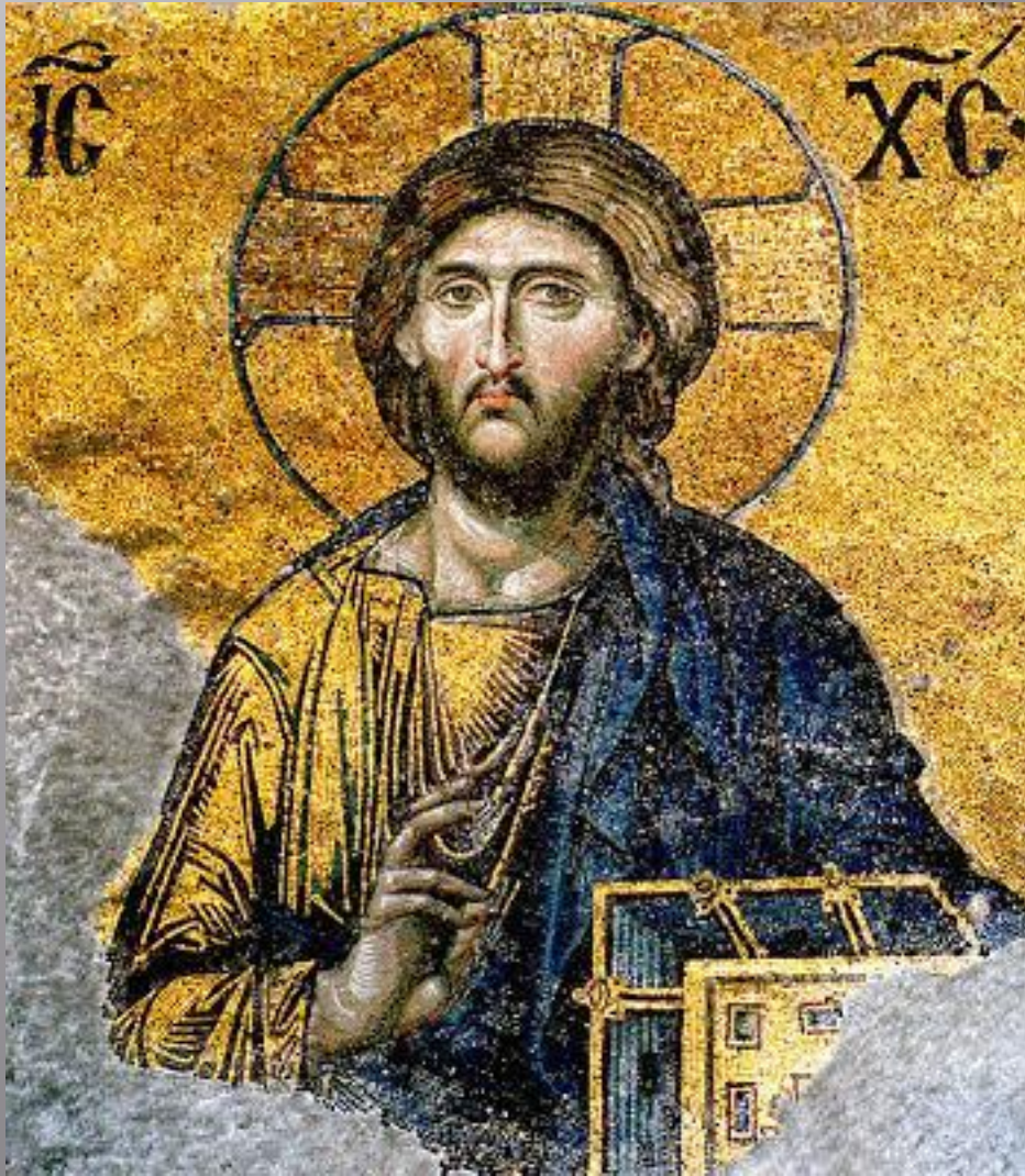
Деисус на южной галерее Софии (вторая четверть XII в.)