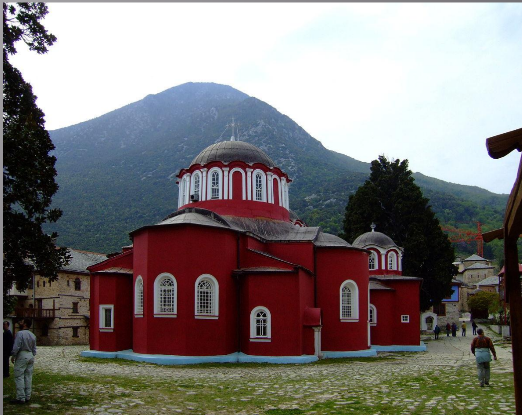
Собор Великой Лавры. XI в. Афон. Греция.