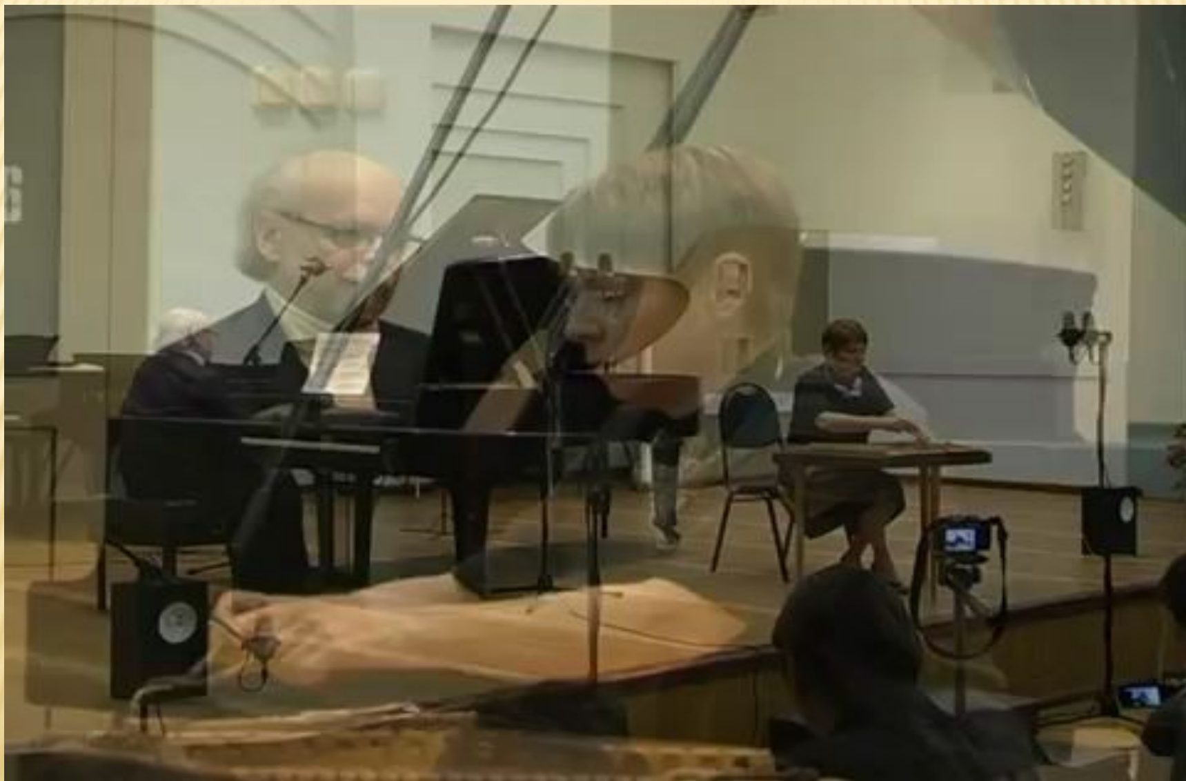
Владимир Копытько «Дивертисмент для цимбал и подготовленного рояля»

Соноризм - один из видов современной композиторской техники, использующей, главным образом, красочное звучание, связанное с переходом от одного тона, созвучия к другому.