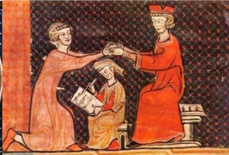
Церемония вассальной клятвы (оммажа). Средневековая миниатюра

Крупные феодалы, герцоги и графы, отдавали часть своих территорий более мелким землевладельцам. Таким образом, одни становились сеньорами (главными), а другие – их вассалами (военными слугами). Вступая в права владения феодем, вассал опускался на колени перед своим сеньором и клялся ему в верности. Взамен господин вручал своему подданному ветку дерева и пригоршню земли.