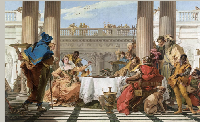
Классицизм в живописи