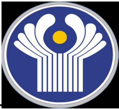
СНГ в борьбе с терроризмом