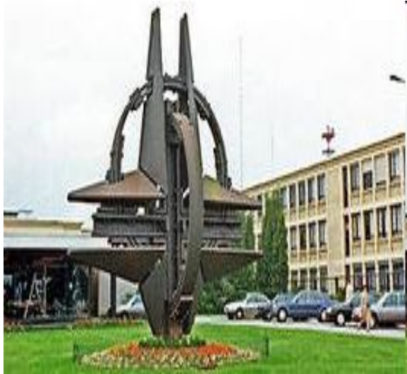
Штаб-квартира НАТО в Брюсселе (Бельгия)