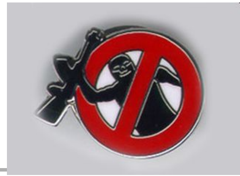
Эмблема ЦРУ по борьбе с терроризмом