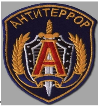
КГБ-ФСБ по борьбе с терроризмом