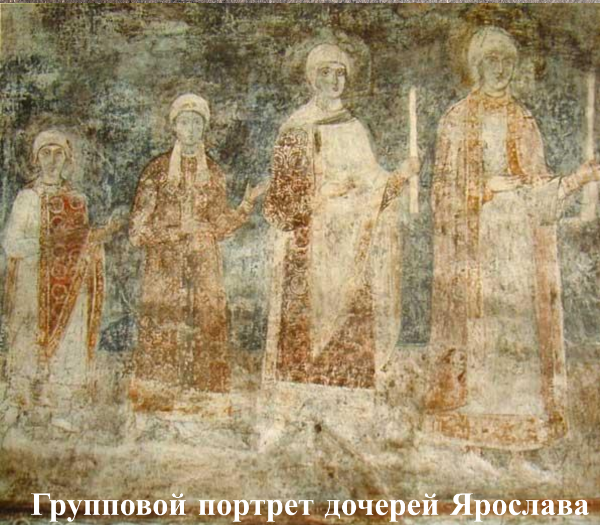
Групповой портрет дочерей Ярослава Мудрого