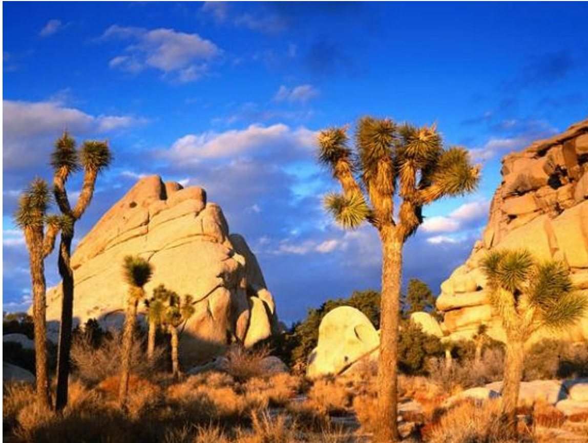
По дороге из Вегаса – Joshua Tree