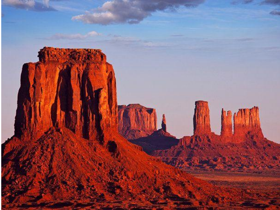
Рядом с Каньоном – Monument Valley