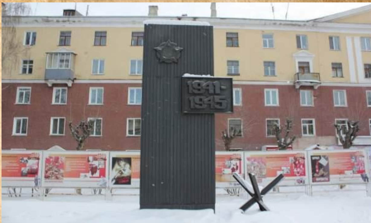
Мемориал Ревдинцам погибшим в годы ВОВ