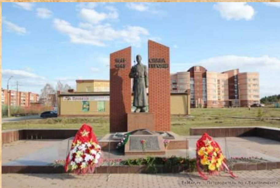
Мемориал работникам кирпичного завода погибшим в боях за родину