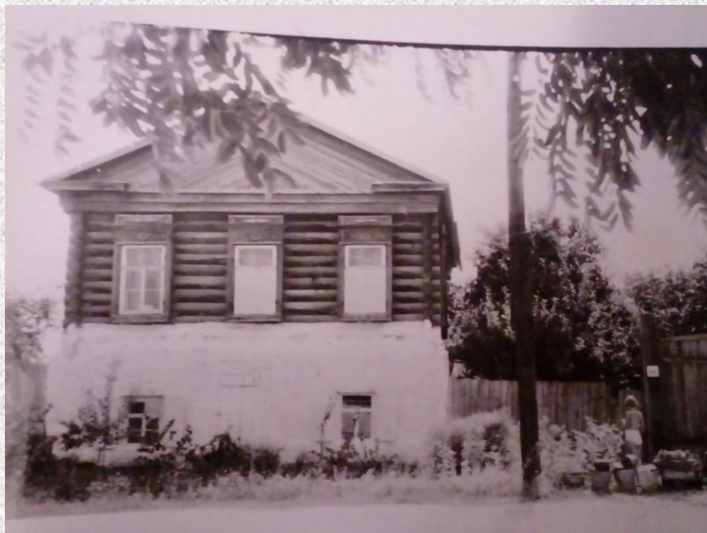
Дом, в котором жил дедушка со своей семьей.