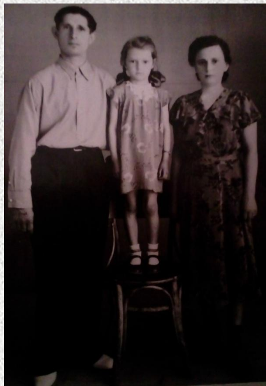
Прадедушка с женой и дочерью.