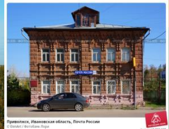
Приволжск, Ивановская область, Почта России