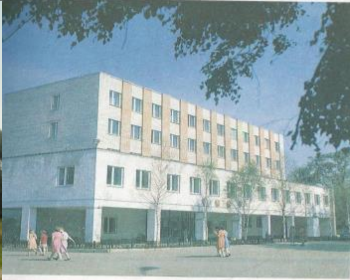
Здание управления комбината