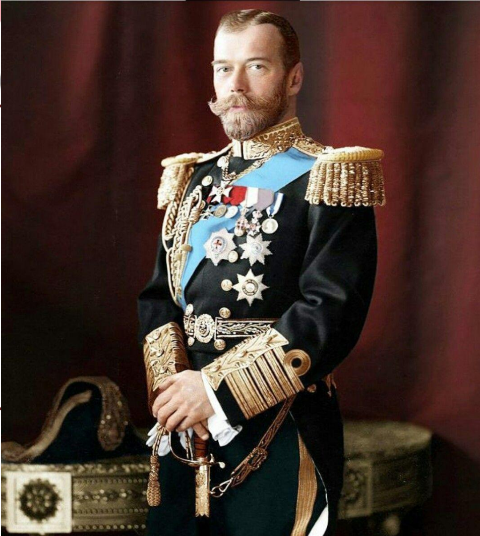
Николай II 1894-1917 гг.

Пройденные темы: русско-японская война 1904-1905 гг.; революция 1905-1907 гг.; реформы П. А. Столыпина; Первая мировая война.