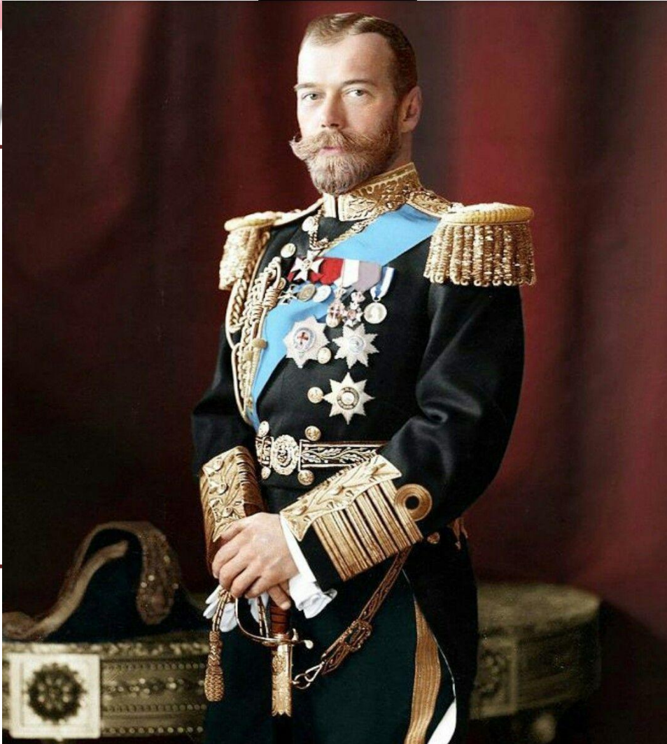
Николай II 1894-1917 гг.

Пройденные темы: русско-японская война 1904-1905 гг.; революция 1905-1907 гг.; реформы П. А. Столыпина; Первая мировая война.