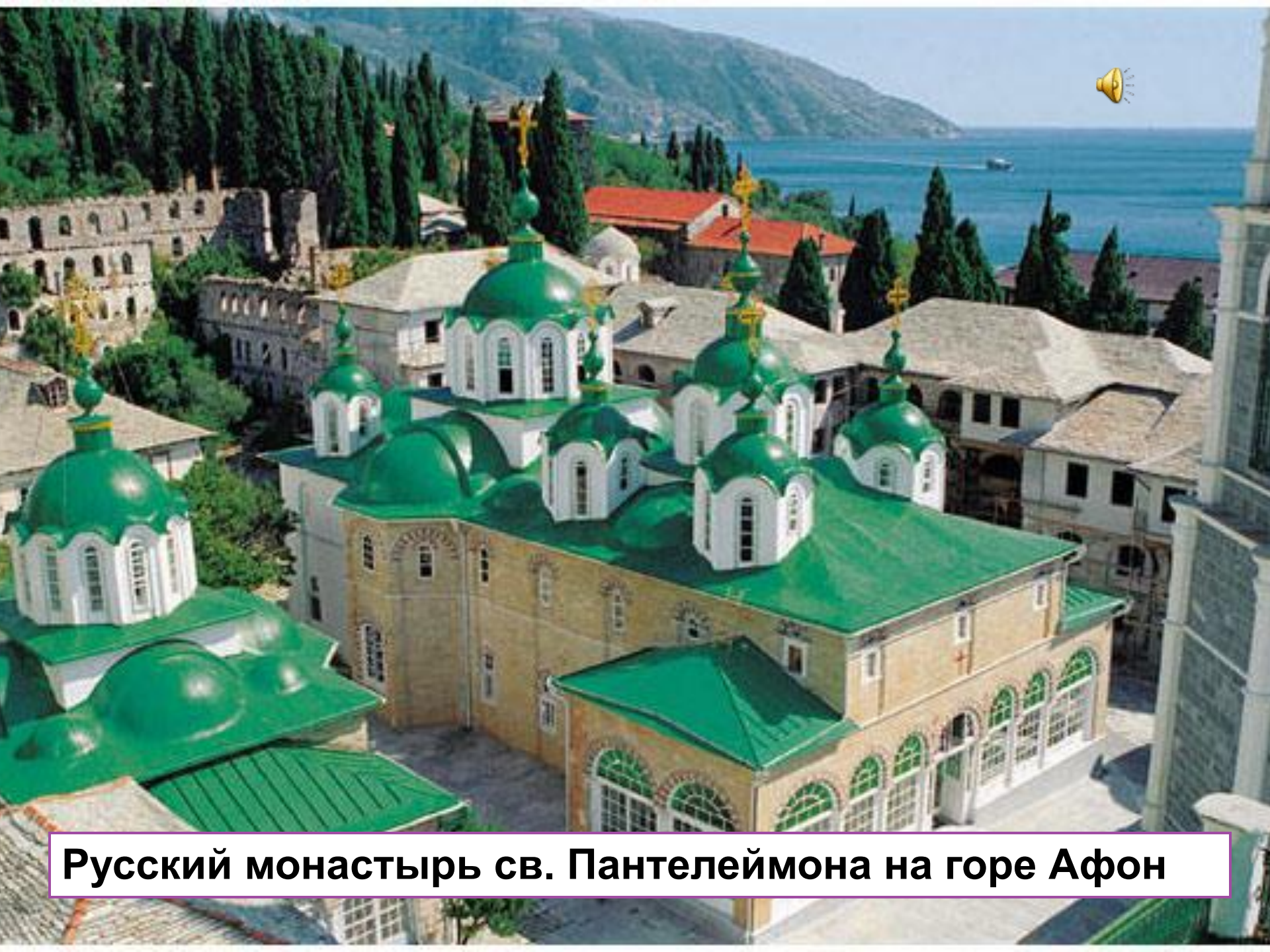
Русский монастырь св. Пантелеймона на горе Афон