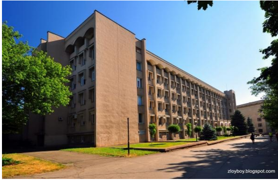
Чорноморський національний університет імені Петра Могили