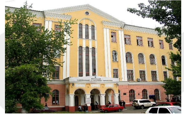
КНЕУ ім. Вадима Гетьмана