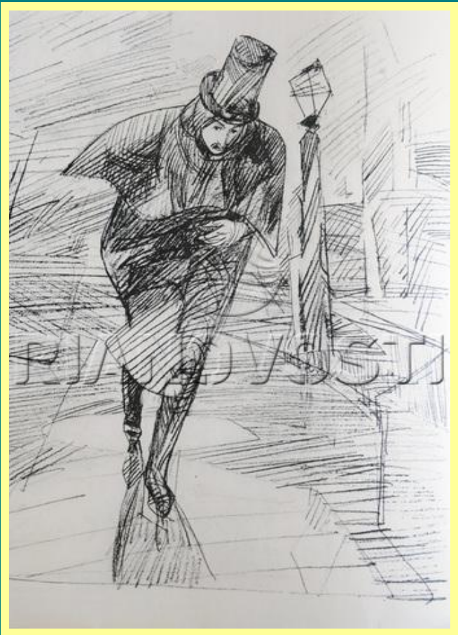
Н.В. Гоголь. Рис. Вит. Горячева

Окончив гимназию в 1828 году, Гоголь едет в Петербург.