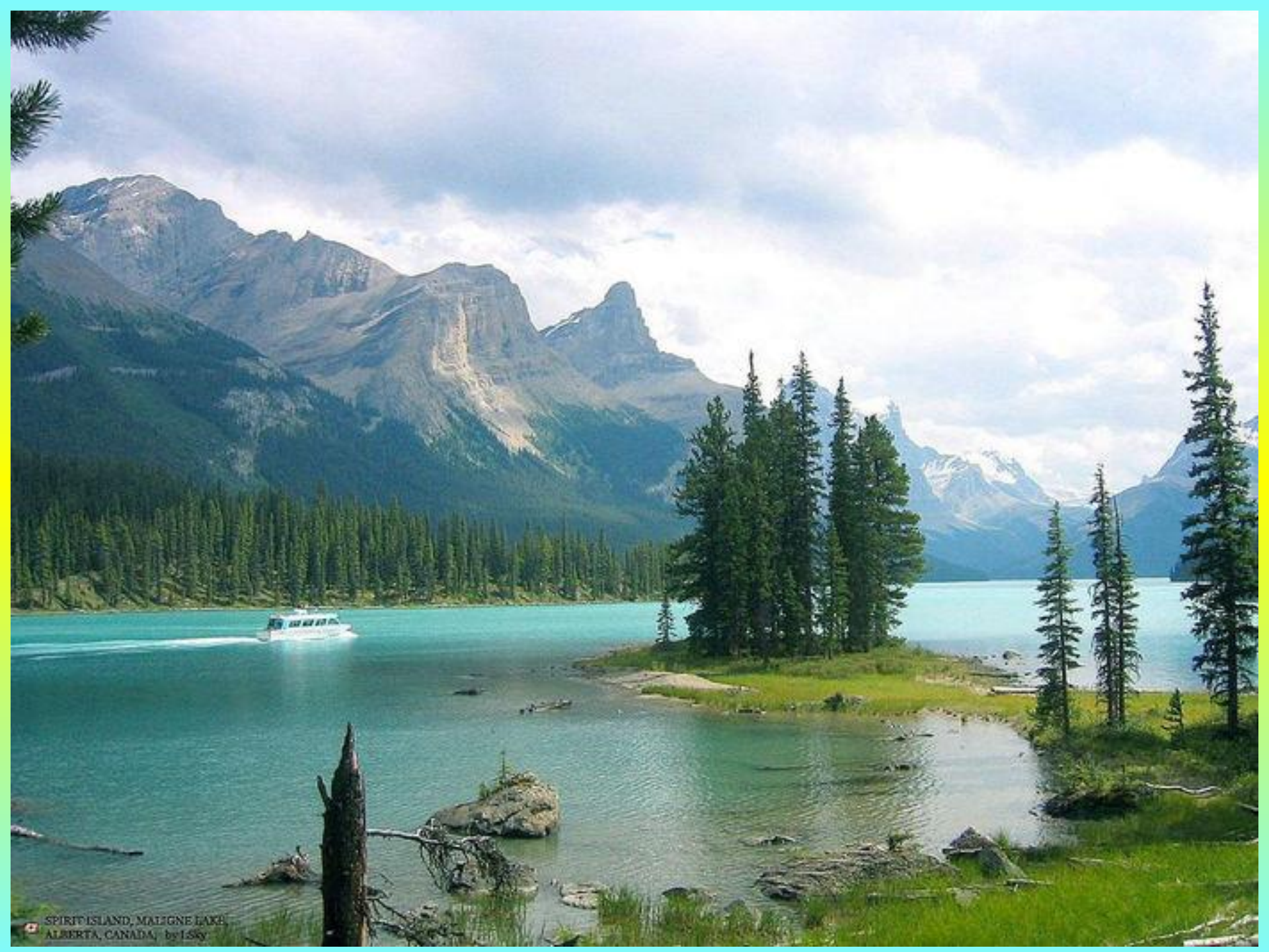
SPRIT ISLAND, MALIGNE LAKE, ALBERTA, CANADA, by LSKy