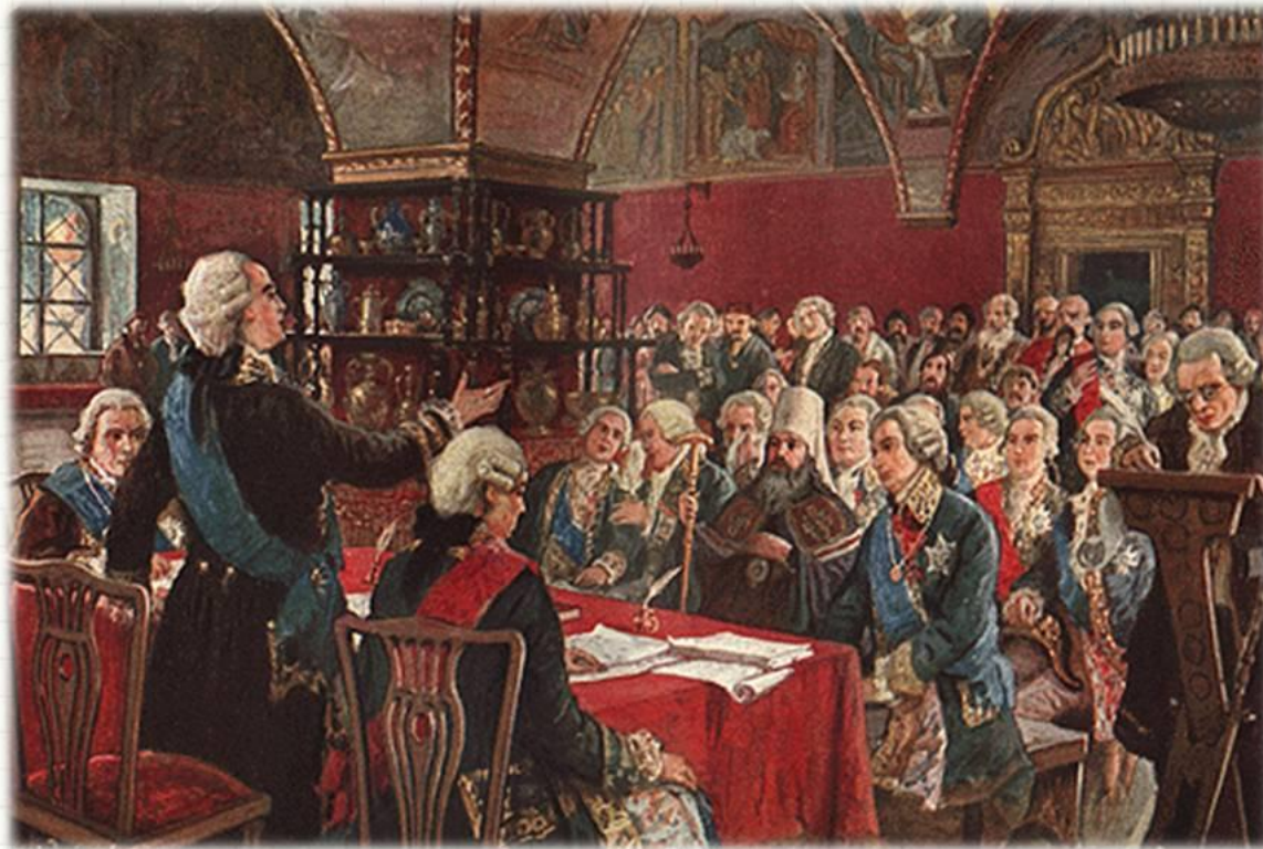
Заседание в Грановитой палате Московского Кремля Комиссии по составлению проекта нового Свода законов - Уложения. 1767 г.

В Москву съехалось более 500 депутатов. Больше всего в так называемой Уложенной комиссии было представителей городов, на втором месте шло дворянство; выборных представителей прислали государственные крестьяне.