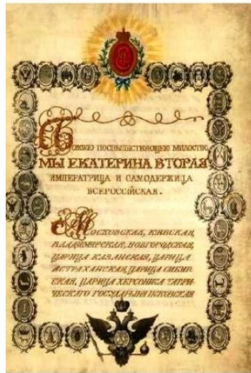
Жалованная грамота городам. 1785 г

Городские жители делились, согласно собственности и доходам, на шесть разрядов. Лишь верхушка города имела право участия в городских собраниях, выбиравших городского голову и других должностных лиц. В городскую думу избирали жители всех разрядов.