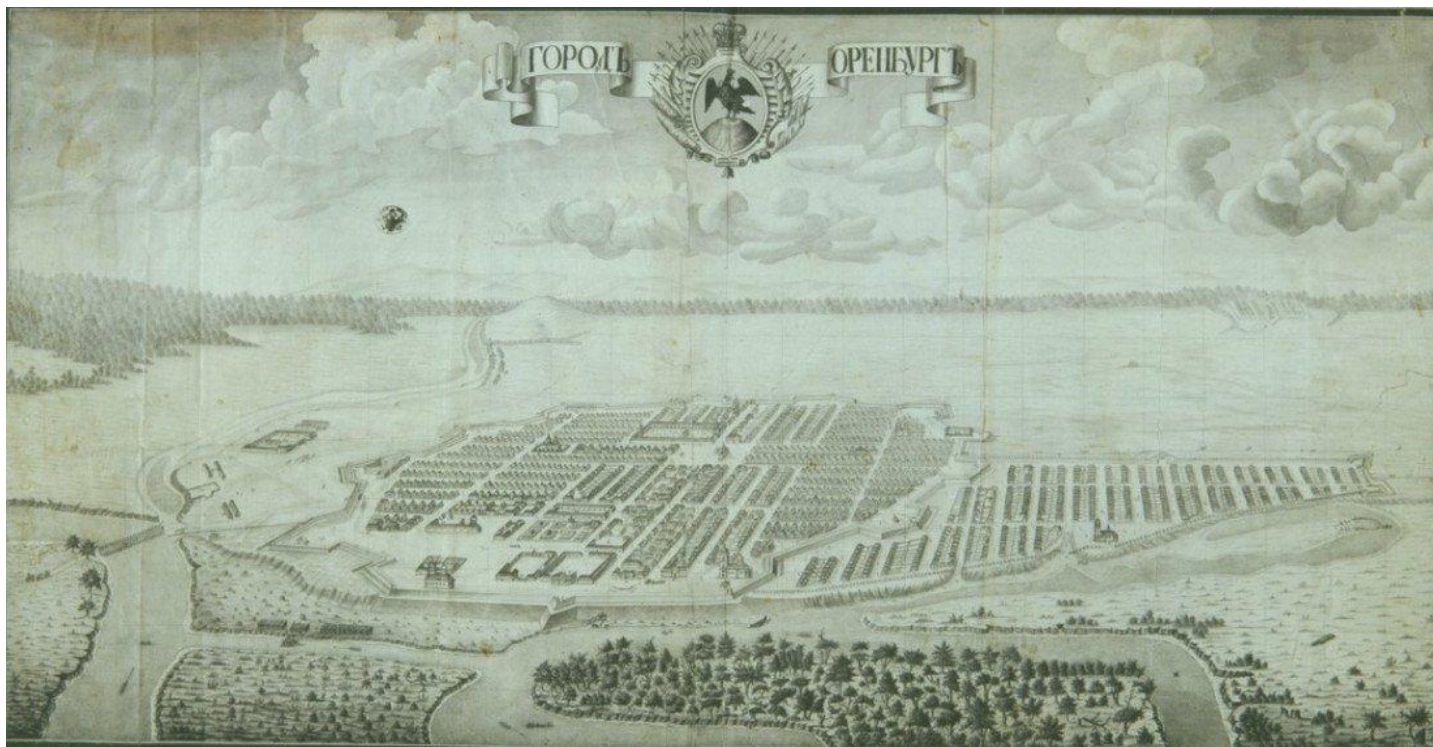
Оренбург 1760 г. План-схема крепости поражает своей геометрически правильной планировкой. На ней хорошо отслеживаются центральная площадь и различные административные учреждения и восточное предместье Оренбурга - казачья слобода.

Мощным очагом недовольства в 1760-е гг. стал казачий Яик. С основанием Оренбурга и строительством оренбургской оборонительной линии правительство стало стеснять казачьи вольности и подчинять казаков оренбургскому губернатору. Введение монополии государства на ловлю рыбы и добычу соли ударило по материальным интересам яицких казаков.