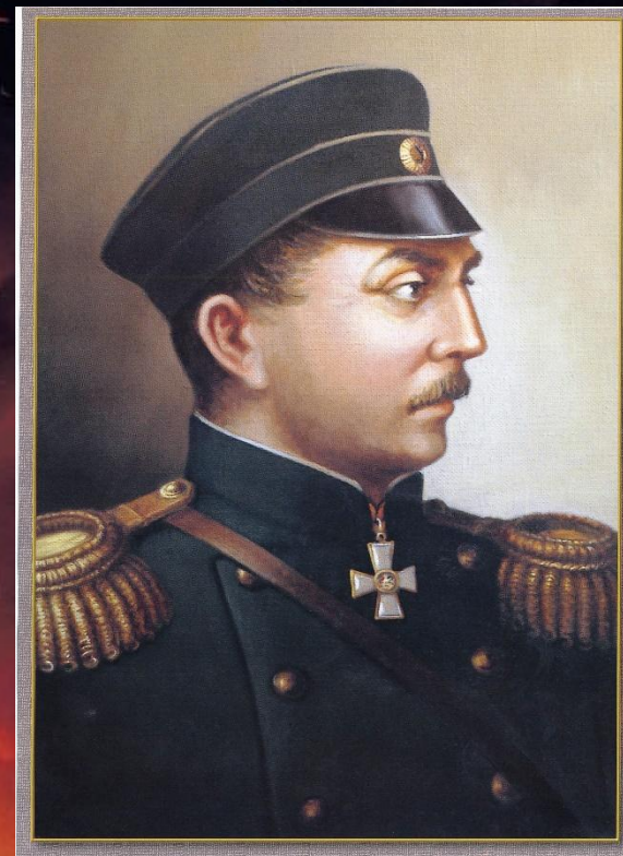
Адмирал П. Нахимов