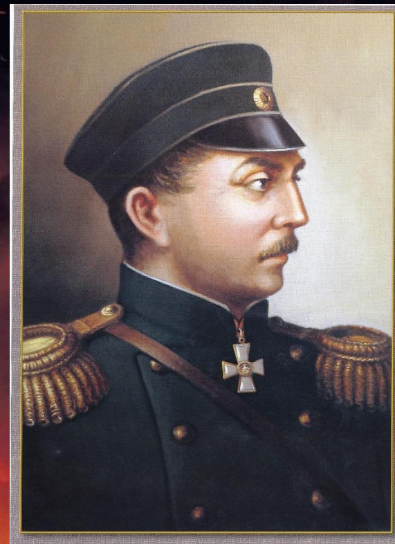
Адмирал П. Нахимов