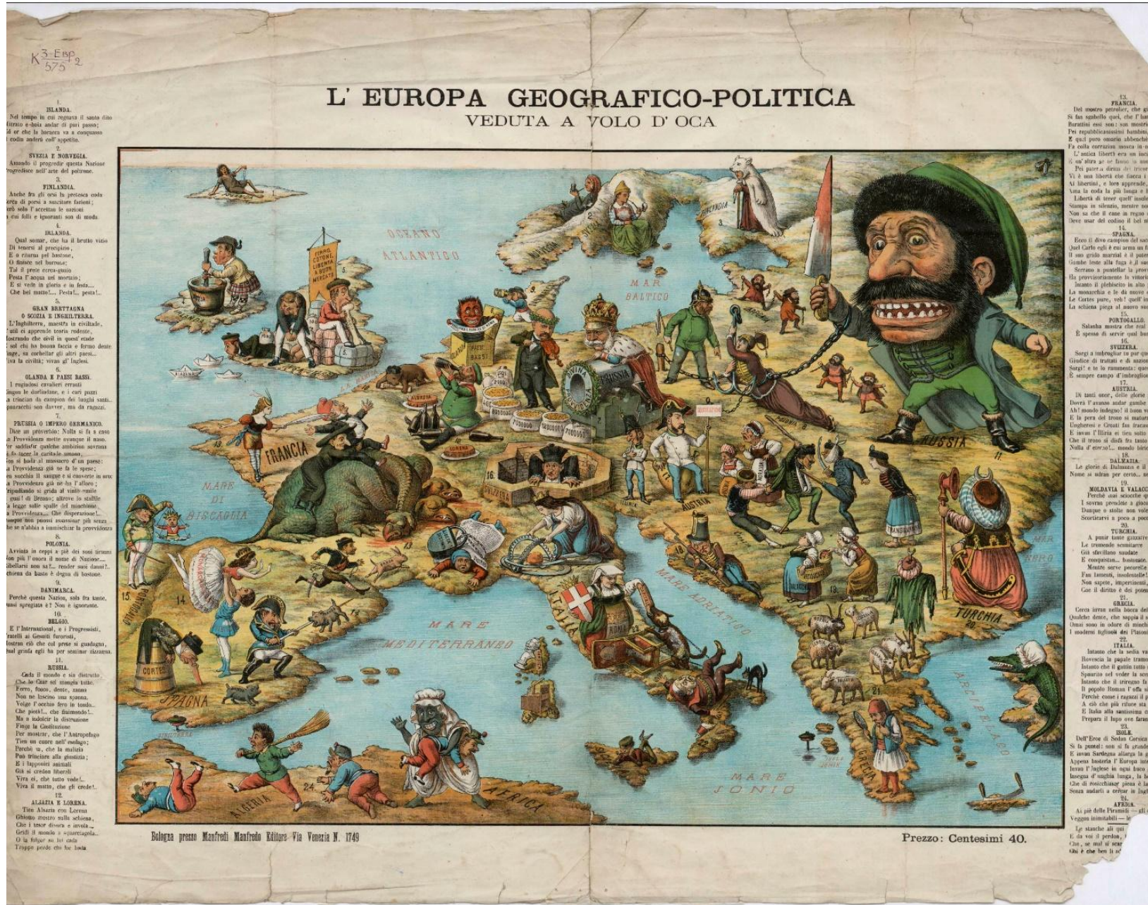
Bologna presso Manfredi Manfredi Editore - Via Venezia N. 1749