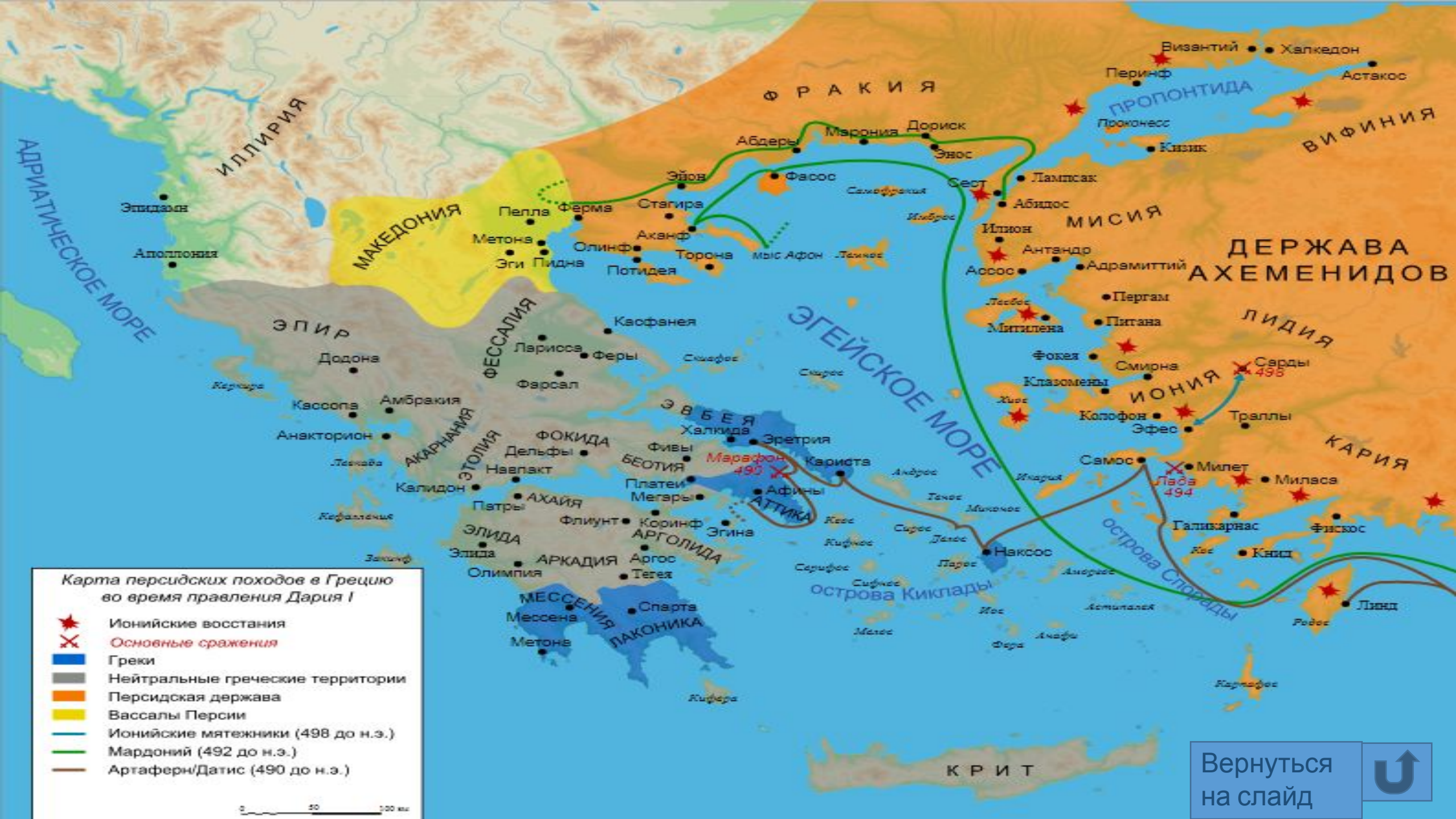
Карта персидских походов в Грецию во время правления Дария I